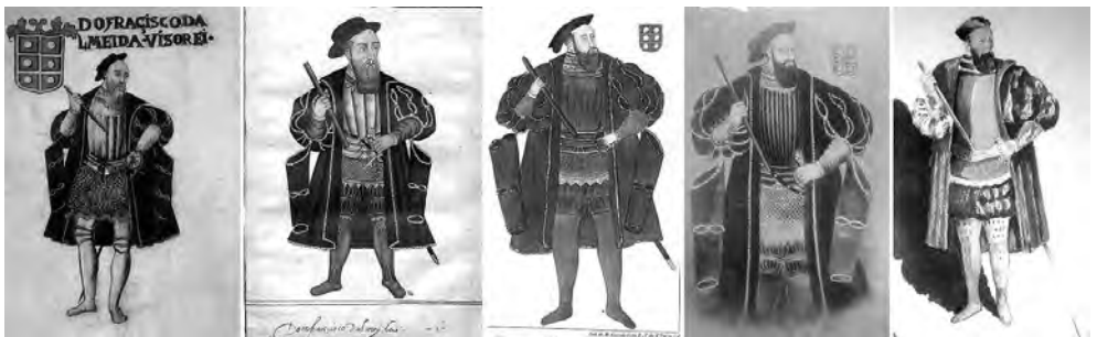
Figura 1-5: Evolução pictórica do retrato de D. Francisco de Almeida entre 1547 e 1894 de acordo com as reproduções da coleção. Da esquerda para a direita: 1560, O Livro de Lizuarte de Abreu; créditos: Biblioteca Nacional; 1646, Pedro Barreto de Resende, Livro do Estado da Índia Oriental, créditos: British Library; 1840, Delorme Colaço, Galleria dos vice-reis e governadores da India Portuguesa; 1890, Roncón, Álbum dos Vice-Reis; 1894, Manuel Gomes da Costa, O Livro dos Vice-Reis da Índia d’el Rei D. Carlos I.

Neste artigo iremos explorar quem foram os intervenientes responsáveis por estas intervenções e os contextos em que ocorreram, tendo por base o estudo da documentação coeva e a descoberta de referências inéditas de processos de restauro do século XIX.