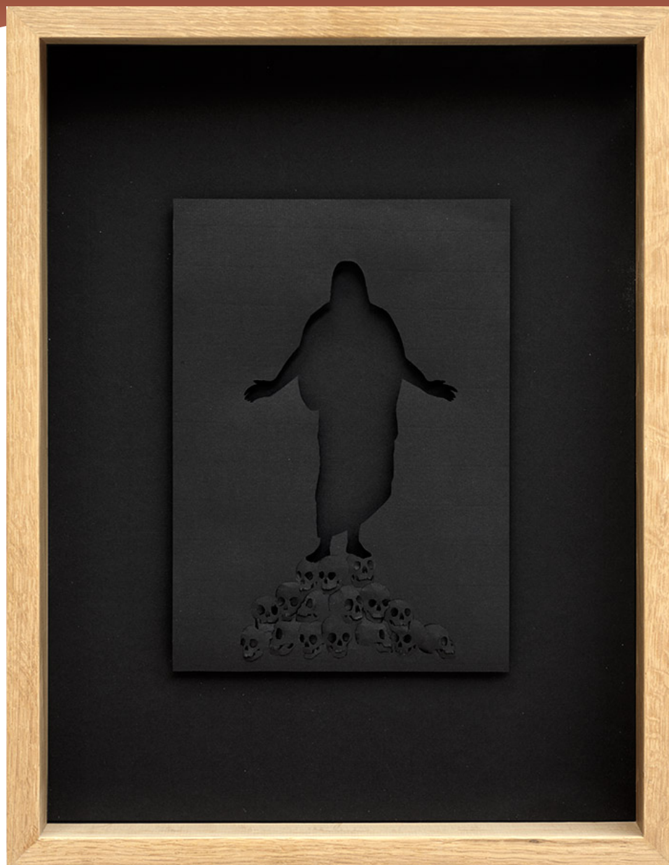
In the Kingdom of the Dead, 2009 Acid-free 110 gsm black paper and oak frame. 53 x 41 x 7 cm