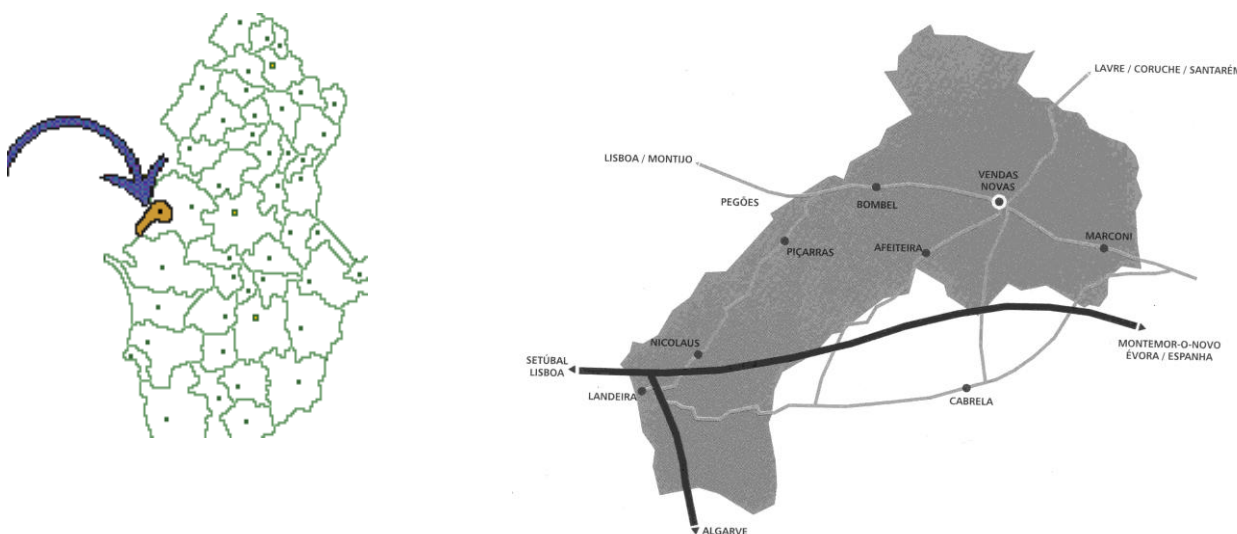
Mapas do Concelho

O seu clima apresenta afinidades mediterrâneas e continentais, caracterizando-se, fundamentalmente, pelo tempo seco e quente. As temperaturas médias no Verão variam entre os 21°C e os 25°C, podendo, no entanto, apresentar temperaturas superiores a 25°C.