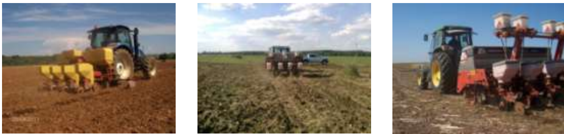
Fig. 1. Operações de sementeira e máquinas utilizadas em cada uma das parcelas (da esquerda para a direita): sementeira em mobilização convencional (Pigeiro), sementeira em mobilização mínima (Comenda) e sementeira direta (Lages).

mês de Abril e de 21°C e de 83 mm em Maio. As análises de solo indicaram a presença de texturas franco argilosas para os solos das parcelas em que se realizou o milho em MC e MM e argilosas para a parcela em SD. No sistema de MC o solo antes da operação de sementeira foi sujeito a: uma passagem de chísel a cerca de 30 cm de profundidade, uma passagem cruzada de grades de discos e uma passagem com um rototerra. Em MM a preparação da cama de sementeira fez-se com uma passagem cruzada de grade de discos. À data de sementeira as percentagens de humidade do solo determinadas a 60°C eram de 14.8%, 11% e 12,5% para as parcelas em MC, MM e SD, respetivamente. Os semeadores utilizados foram em MC marca RAU modelo Maxem, em MM marca Semeato modelo SPE e em SD marca Semeato modelo SSE. Todos os semeadores têm um trem de sementeira, constituído por 4 linhas, com uma entre linha de 0.75m, órgãos sulcadores de duplo disco desfasado, roda controladora de profundidade e controlo de pressão da linha por tensão mecânica de uma mola amortecedor ajustada para 3 cm de profundidade. A densidade de plantação usada foi de 85000 plantas por hectare. As velocidades médias de operação foram de 4 km h -1 em MC e MM. Em SD usaram-se duas velocidades de trabalho de 4 e 6km h -1 .