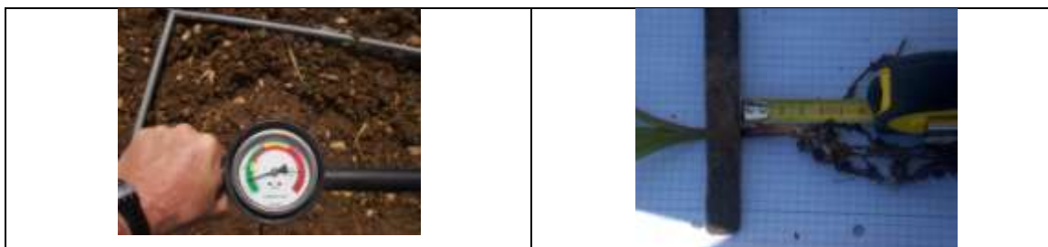
Fig. 2. Mostrador do penetrômetro de cone para determinação da resistência mecânica do solo ao rompimento (à esquerda) e determinação da profundidade de sementeira pela avaliação do comprimento do mesocótilo de plantas de milho pós emergência.

Recorrendo ao software estatístico Statistica 6.0 (StatSoft®), para ambos os parâmetros foram determinados as médias, desvio padrão, coeficiente de variação e coeficientes de correlação. para avaliar a influencia da resistência de rompimento do solo e dos sistema de preparação do solo na profundidade de sementeira procedeu-se a uma ANOVA e à comparação de médias pelo teste de Tukey. Num SIG usando o software ArcView 9.0, por interpolação dos valores obtidos foram criados os respectivos mapas de variabilidade espacial de resistência do rompimento do solo e de profundidade de sementeira.