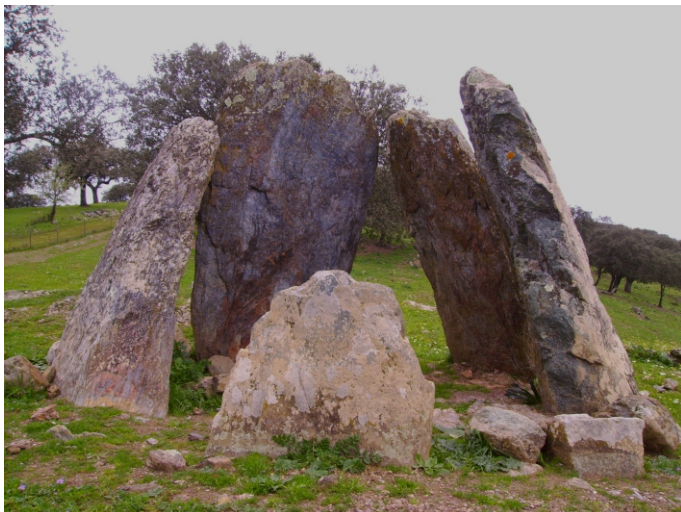
Fig. 3 - Anta da Negrita 1