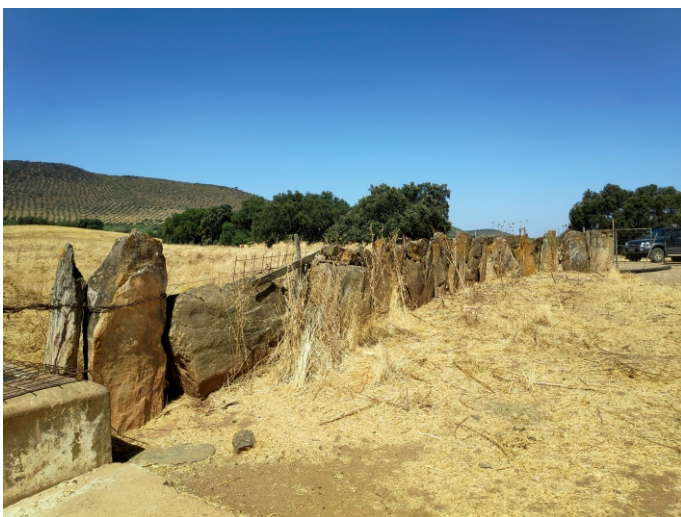
Fig. 5 - Reaproveitamento de esteios em Monte do Touril.