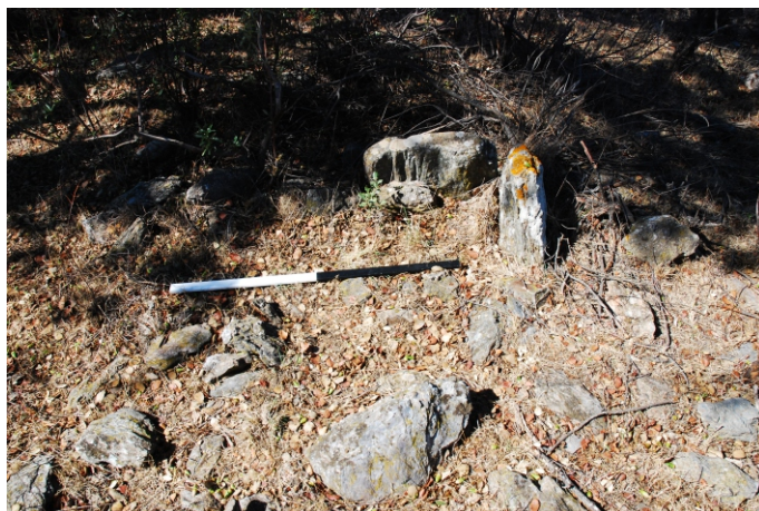
Fig. 4 - Mamoas das Abroteiras.