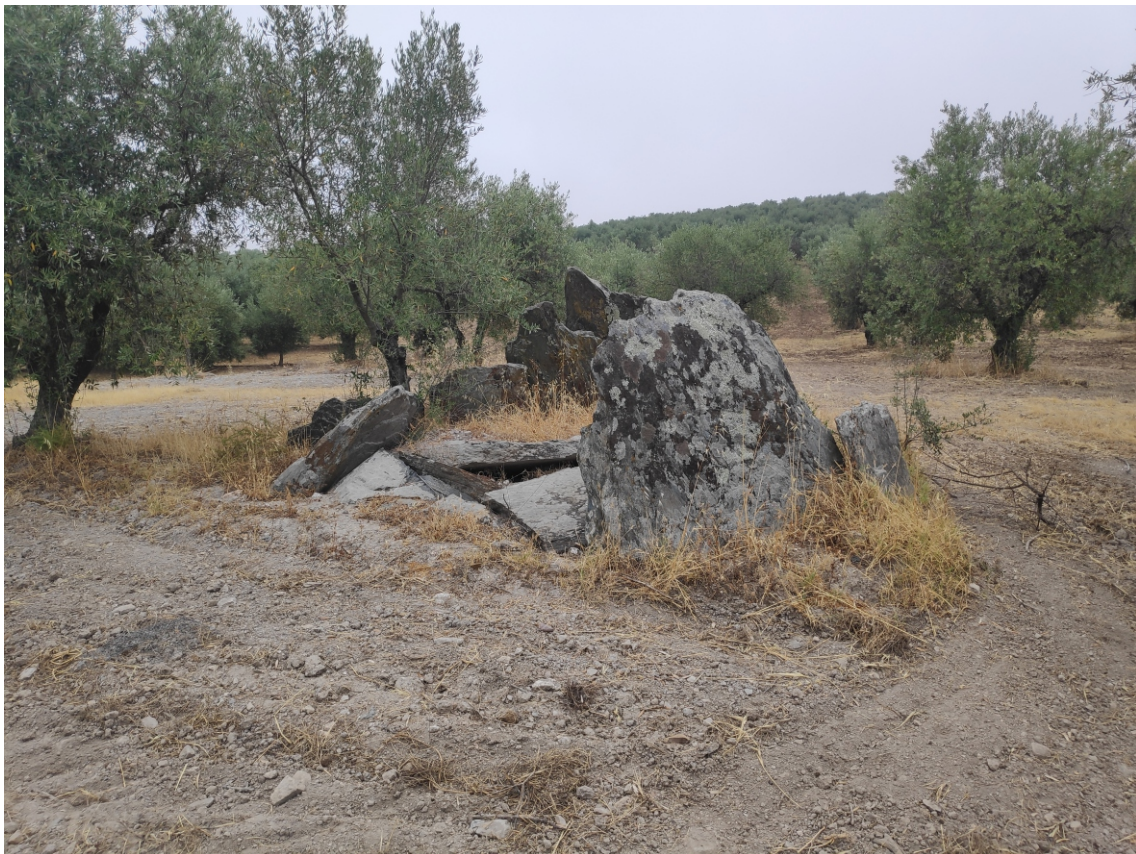
Fig. 2 - Monte Novo das Antas 3.