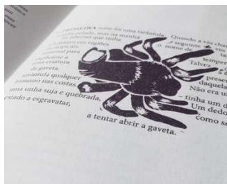
Figura 3 - Fotografia da página 3, página seminal do presente artigo https://www.instagram.com/p/Bkm3AHGgB-j/

A expressão que é designação e simultaneamente conceito de blast over surgiu-nos inspirada numa página do livro de Filipe Homem Fonseca que se analisará (ver a figura seminal em fig.3). Usá-la-emos para tratar as questões da leitura literária de objetos em que se cruzam linguagens (verbal, icónica e gráfica), criando um discurso que adensa enigmas, apesar da informação que a diversidade de signos escolhidos parece disponibilizar. E será de uma perspetiva pragmática que os objetivos deste estudo se alcançarão: interpretar o texto dentro do objeto, que é um livro, mas que pode ser apenas uma narrativa, de forma a transformá-lo numa espécie de memória descritiva de um corpo tatuado. O livro, animado pela leitura em cruzamento multimodal, graças à ilustração e design gráfico, voltará, em algum momento do percurso do seu leitor, a valorizar-se pelo literário da gramática verbal que, numa argumentação opinativa, sai mais acrescentado.