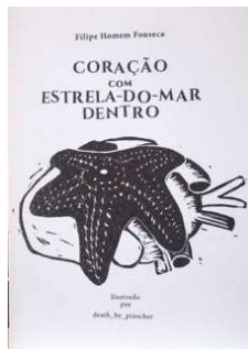
Figura 1 - Fotografia de capa