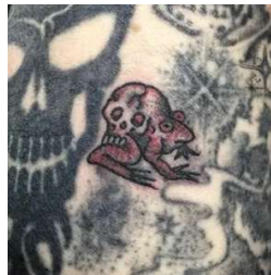
Figura 2 - Fotografia com exemplo de blast over

Supergigante , apesar de se construir em torno da morte, acaba luminoso. Coração Com Estrela-do-Mar Dentro é um conto sombrio, do princípio ao fim. E até para lá dele, na reflexão, o que só se confirmará e provará depois do exercício da leitura, além da epidérmica, ou visceral, reação. Mas esta reação é a que se espera de um conto que se constrói em torno do que podemos chamar maldição, para evitarmos mencionar a palavra de uma forma de morte que não decorre do natural fim da vida. E esta é a voz de Filipe Homem Fonseca, autor que não parece preocupado em escrever a pensar na idade de quem o lê, mas nos universos surpreendentes que as palavras conseguem construir, a partir de realidades muitas vezes tão tristemente óbvias para os mais atentos e (pre)ocupados em ler o mundo e os indivíduos. Sobre este conto, e também sobre a dificuldade em dirigir-se literatura aos mais novos de idade, escreveu João Paulo Cotrim numa crónica do jornal eletrónico Hoje Macau :