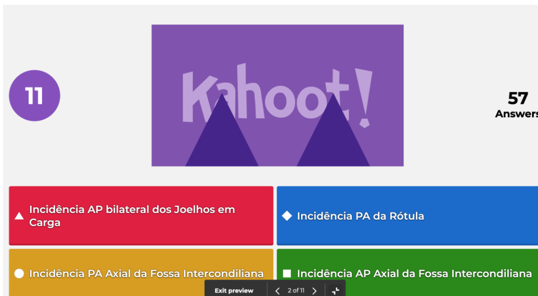
Figura 2 – Questão de escolha múltipla desenvolvida dentro do ambiente Kahoot!, com recurso a estratégias de gamificação, de forma a consolidar conhecimentos teóricos no âmbito do estudo radiológico convencional do membro inferior.

É também de salientar que após o término do jogo, é elaborado automaticamente um relatório para monitorizar e acompanhar os resultados individuais do formando. E a partir destes resultados, devem ser adotadas estratégias para as lacunas identificadas, visando a melhoria contínua dos conhecimentos adquiridos. Através da figura 3, podemos observar a título de exemplo que foram identificados cinco questões nas quais os formandos tiveram mais dificuldades, e que nove dos formandos necessitam de um suporte mais direcionado em determinadas temáticas 34 . Existe ainda a possibilidade de exportar um arquivo no formato excel (figura 4), que contém uma visão geral dos resultados, as classificações finais de cada formando, bem como os resultados individuais para cada questão do jogo 34 .