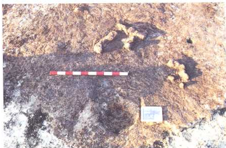
Fig. 2: Pormenor da Unidade Estratigráfica 39.