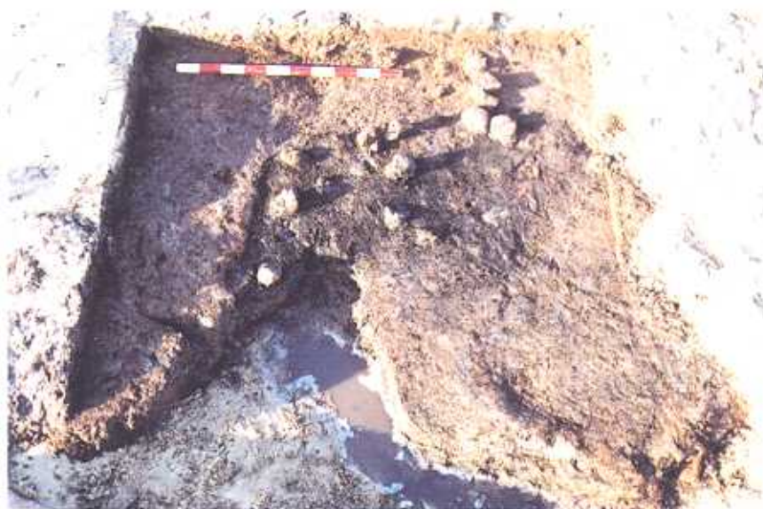
Fig. 3: Estrutura de combustão.