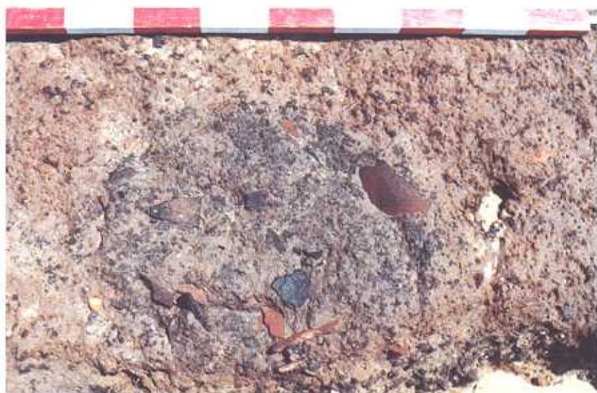
Fig. 4: Pormenor de uma das fossas.