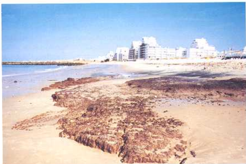
Fig. 1: Vista geral do sítio arqueológico.