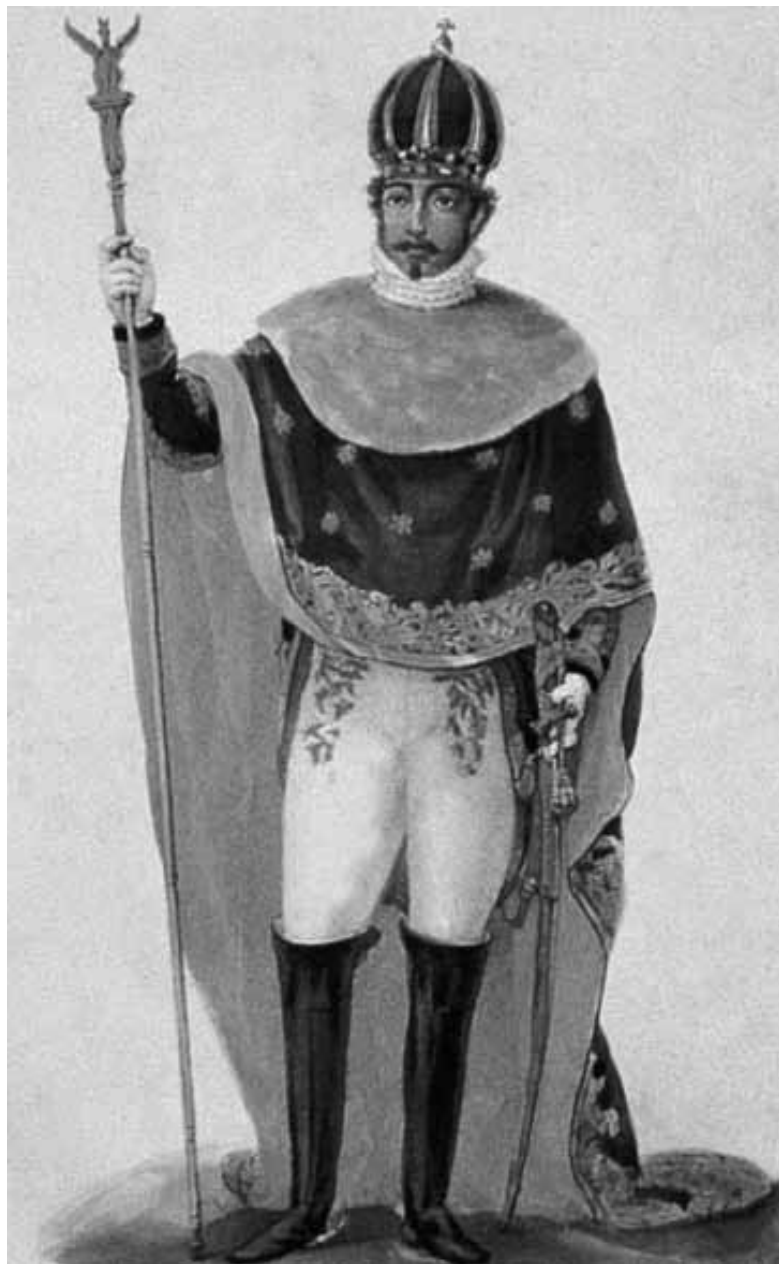
Figura 2. Jean-Baptiste Debret, coroação de d. Pedro I, gravura. DEBRET, Jean-Baptiste. Viagem pitoresca e histórica ao Brasil . Trad. Sérgio Milliet. Belo Horizonte: Itatiaia; São Paulo: Edusp, 1989. v. III, prancha 10. Reprodução digital de Dias (2006).

pitoresca e histórica ao Brasil , publicada em três volumes entre 1834 e 1839, em Paris, apresenta uma série de ilustrações correspondentes aos principais eventos ocorridos no reinado de d. João VI e império de d. Pedro I, além da construção de uma iconografia de caráter nacionalista, inteiramente nova, relativa ao Primeiro Império (Dias, 2006).