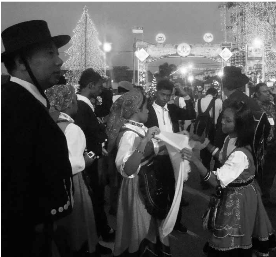
Figura 4. Dançarinos de um dos grupos musicais do bairro português de Malaca, numa pausa entre performances, durante as festividades de celebração do Natal de 2008.

Os objetos que circulam entre os kristang , referentes ao folclore português, têm um valor interno enquanto coisas identitárias, e, ao mesmo tempo, uma certa pátina de antiguidade, em referência a um mito de origem construído, o mesmo a que se refere Jean Baudrillard (1972) quando interpreta os sistemas de objetos em análise na sua obra, hoje, clássica. Diz-nos ele que: