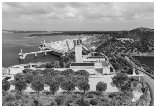
Figura 8 - Vista da proposta

O reconhecimento in situ da topografia revelou-se determinante para a opção arquitetónica de integrar a volumetria da proposta na depressão existente e de participar na reconstituição da encosta de Mira Lagos. Esta opção possibilita que, com a implantação do POCCI, se criem distintos momentos e ambiências de acolhimento dos visitantes.