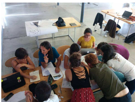
Figura 1 - Trabalho de grupo

O Departamento de Arquitetura da Universidade de Évora, promoveu em 2016 o 2º Workshop Internacional de Arquitetura 1 - “Alqueva: temporalidade do turismo Arquitectura(s) para uma nova territorialidade”. Esta iniciativa integrada na rede internacional de escolas de arquitetura " Designing Heritage Tourism Landscapes " e teve como parceiro a Empresa de Desenvolvimento e Infraestruturas de Alqueva (EDIA).