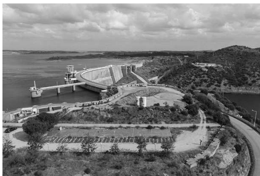
Figura 7 - Vista do local de intervenção