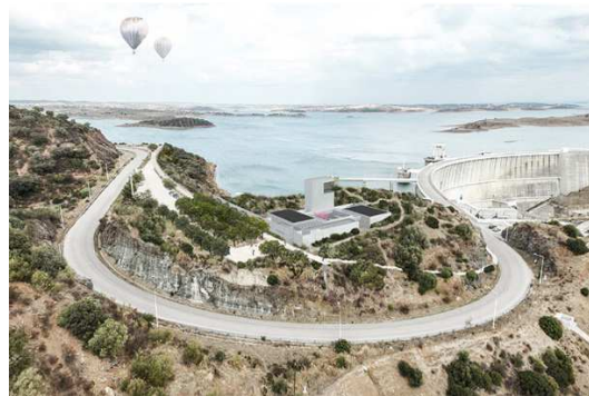
Figura 6 - Vista da proposta

O projeto de arquitetura (ver Figura 6 e Figura 8) para além da componente organizacional dos vários espaços requeridos pelo promotor (componente funcional) procurou traduzir e implementar um marco edificado não só em termos territoriais como em termos espaciais internos (componente espacial). A definição dos volumes edificados e a sua organização foram sendo definidos em relação com um pátio interno e com a envolvente natural (lago e território).