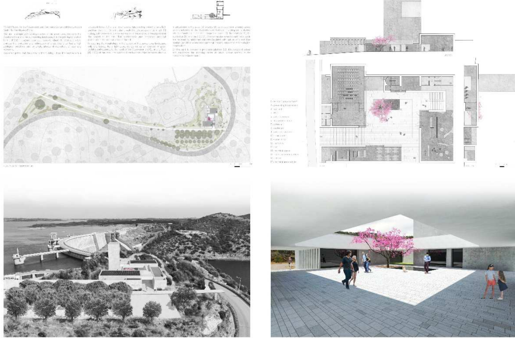
Figura 10 - Segundo painel de apresentação do projeto

O programa do edifício do POCCI divide-se em 4 núcleo funcionais: o centro interpretativo (CI), a cafetaria, o auditório e o posto de e comando (POC). Tornou-se óbvio fazer corresponder cada um destes programas funcionais, a construções distintas, que se articulam em torno do de pátio de recepção. O pátio é, não só, o espaço de excelência para o acolhimento, como o lugar fundamental da vivência do POCCI, como também, uma resposta bioclimática. O CI terá um carácter informativo, didático e científico, dispondo de um conjunto de pequenos núcleos expositivos e interpretativos sobre a Barragem, o EFMA, o Guadiana, a paisagem, a agricultura e a área de regadio. A base da torre incluirá, ainda, uma sala interpretativa do Alqueva onde será colocado um periscópio que permitirá observar paisagem vista do nível superior da torre. Na torre, semelhante a um farol, será instalado o POC, permitindo por um lado observar (e controlar) os órgãos de segurança da barragem, assim como se torna numa referência neste território. O auditório é concebido e equipado de modo a assegurar a realização de múltiplos eventos, terá a possibilidade de funcionar como um elemento autónomo, com um funcionamento independente dos restantes programas. Estes programas são apoiados por uma cafetaria onde o visitante pode fazer uma pausa e desfrutar de uma refeição leve, num ambiente