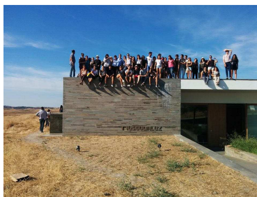
Figura 2 - Visitas de estudo ao Alqueva

Nesta atividade académica, que decorreu em Évora entre 9 e 16 de setembro, participaram cerca de 100 alunos, tutores e docentes internacionais das várias universidades que integram a rede internacional, tendo sido desenvolvido um trabalho/exercício de projeto/conceção junto da barragem de Alqueva. O grande lago, objeto, de transformação foi o mote do exercício desenvolvido durante o Workshop, que procurou novos olhares e modos de (re)habitar esse território (Salema, 2014). Para promover a compreensão da vocação do lugar e estimular nos alunos a importância da construção do lugar como uma estratégia conceptual do projeto de arquitetura, o workshop contou com a colaboração de docentes de várias áreas disciplinares, designadamente da arquitetura e da arquitetura paisagista (ver Figura 1). Outras