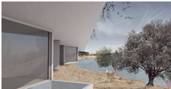
Figura 3 - Proposta Grupo 1

iniciativas as visitas de estudo ao local e região (ver Figura 2), as conferências temáticas foram imprescindíveis instrumentos de reflexão, leitura, interpretação e representação das características do território.