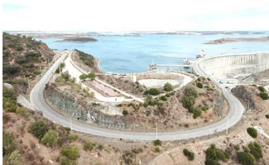
Figura 5 - Vista do local de intervenção

Reconhecendo o valor intrínseco, privilegiado e estratégico deste lugar, para a localização, do Posto de Observação e Comando da barragem e Centro Interpretativo (POCCI) de Alqueva, a estratégia global de projeto propôs (re)construir este lugar. O projeto revela-se, assim, como uma oportunidade não só para instalar o POCCI, como de (re)construir um território destruído e degradado, de refazer a colina e de promover a proteção e valorização de áreas que possuem uma elevada sensibilidade ecológica. A intervenção alargou-se então ao lugar de Mira Lagos incluindo o redesenhar a colina, o revestir com o coberto vegetal potencial desta paisagem e, ainda, criar lugares de recreio, de estadia e de miradouro.