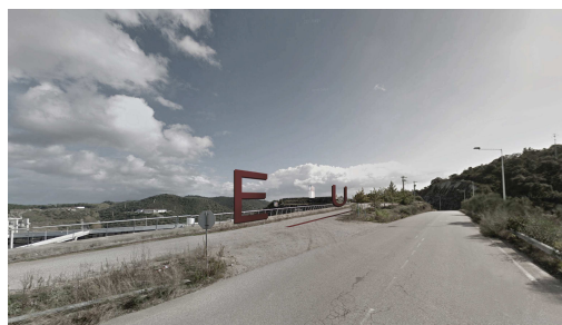
Figura 4 - Proposta Grupo 3

Os alunos tinham dois locais (relativamente próximos do muro/paredão da barragem) com programas distintos para desenvolverem o exercício: o Monte dos Pardieiros e Centro de acolhimento de visitantes/ Posto de observação e controlo. O Monte dos Pardieiros é uma antiga casa em ruínas que ganhou uma relação muito especial com o lago e que a EDIA pretendia adaptá-lo a uma função turística. Mais perto da barragem a EDIA pretendia construir um edifício que combinasse dois programas funcionais distintos: Centro de Acolhimento para visitantes e Centro de Observação e Controle (CACOC). Organizados em pequenos grupos foram desenvolvidas 5 propostas de conceção para o CACOC (ver Figura 3 e Figura 4). Os projetos foram apresentados em sessão pública na Fundação Eugénio de Almeida.