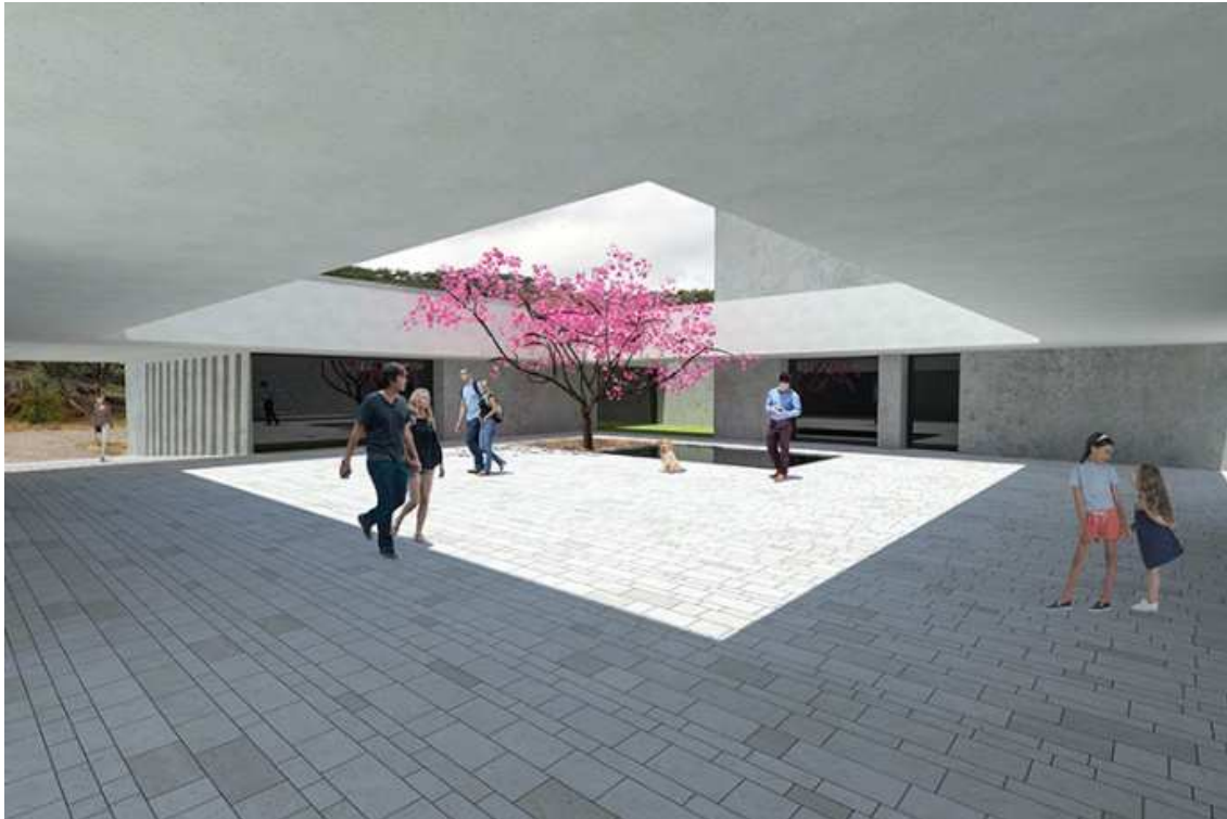
Figura 11 - Ambiente do pátio

que se estende naturalmente para o exterior, com uma vista privilegiada para o rio Guadiana, para a cidade de Moura e paisagem envolvente.