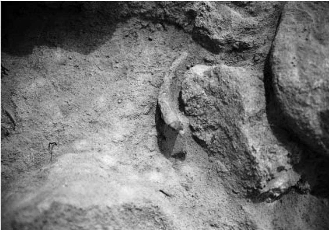
FIG. 3 – Enterramento I: aspecto inicial.