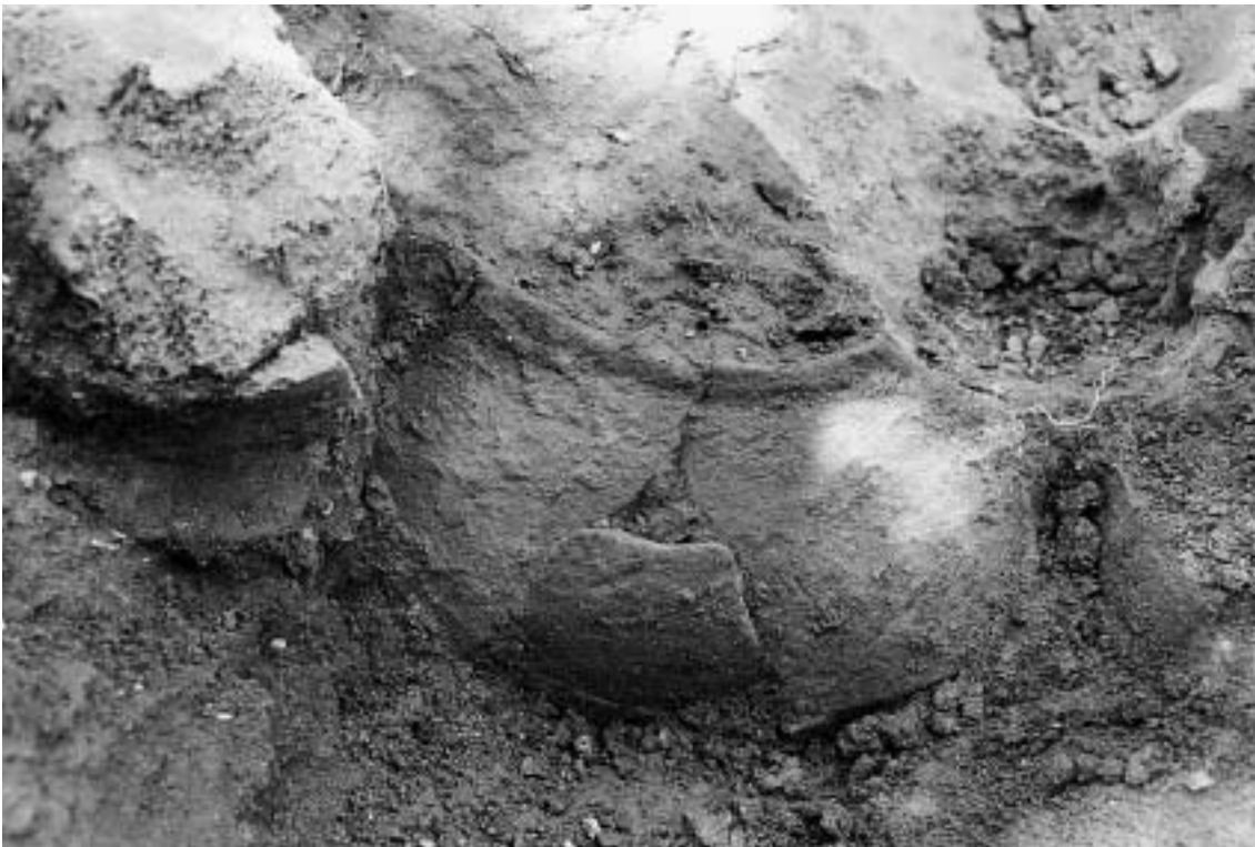
FIG. 4 – Enterramento I: pormenor de uma das urnas.