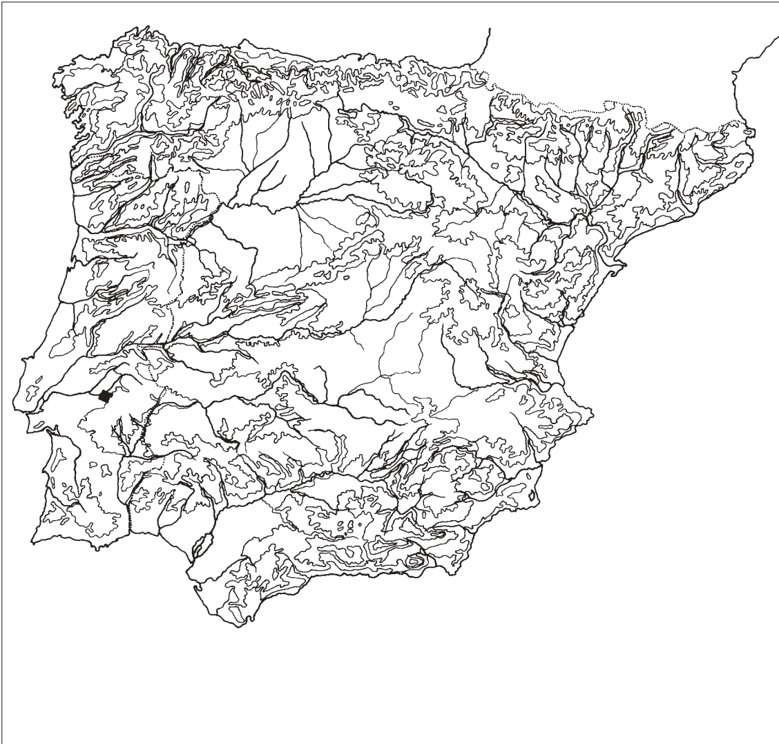
FIG. 1 – Localização da área de Pavia na Península Ibérica.