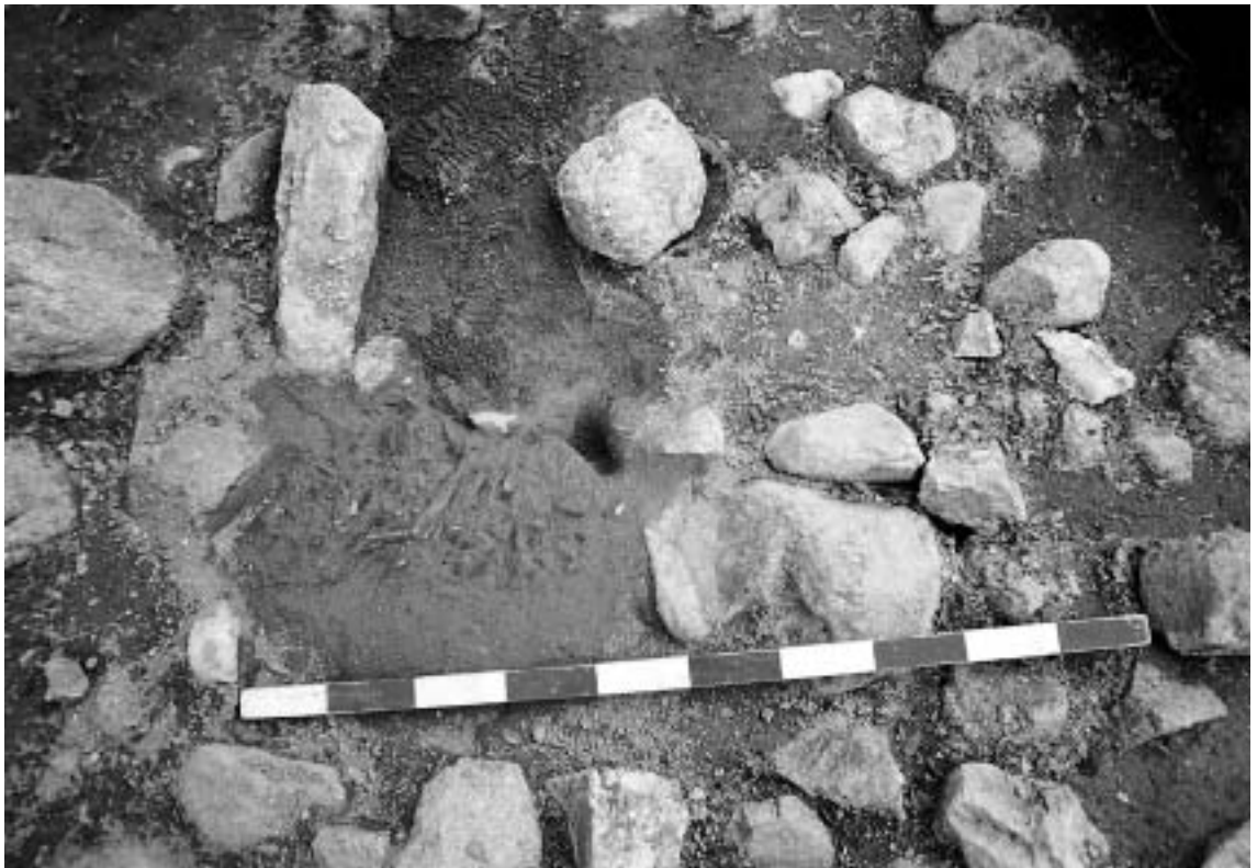
FIG. 5 – Enterramento 2: aspecto inicial.