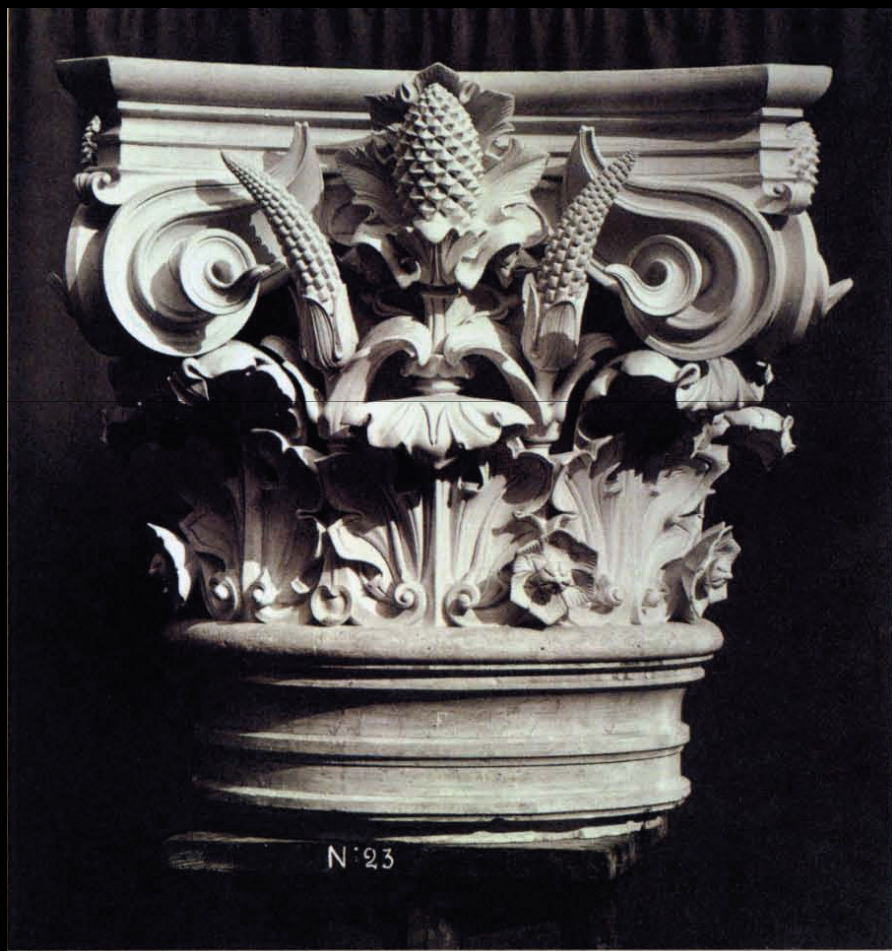
Maqueta em gesso dos capitéis das colunas da Ópera Garnier de Paris, Charles Garnier ( 1864