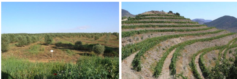
Figura 5: Olival com envelvamento à esquerda e vinha em socalcos à direita. Em ambos os casos se mantém o revestimento vegetal do solo na entrelinha.

As alterações climáticas previstas para o nosso país sugerem uma maior concentração da precipitação e um aumento da frequência de eventos extremos (Santos et al., 2002), o que tende a aumentar o risco de ocorrência de eventos erosivos e deveria tornar mais imperiosa a adopção de medidas de conservação do solo.