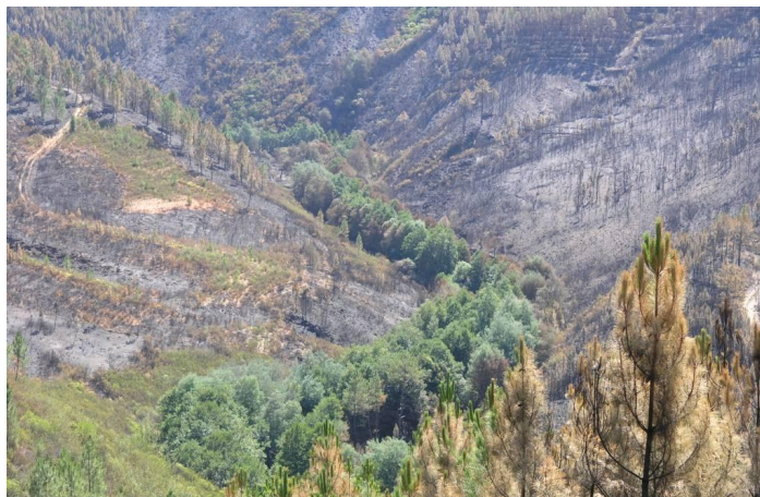
Figura 7: Área afectada por incêndio florestal em que se evidencia a resistência da vegetação ripícola à passagem do fogo.

Os exemplos focados neste ponto e no anterior reflectem uma passagem muito breve sobre alguns usos do solo com relevância no país, salientando a sua relação com a degradação do solo mas, também, apontando medidas de conservação que podem reduzir as externalidades desses usos (ou os desserviços que causam) e manter os serviços do solo a longo prazo.