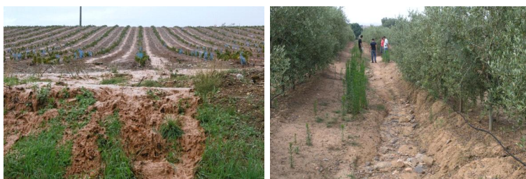
Figura 4: Evidências de processos erosivos em vinhas e olivais novos.

Embora os dados do INE (GPPAA, 2009) não indiquem uma variação sensível das áreas totais de culturas permanentes à escala nacional, é bem conhecido o investimento em novas vinhas e olivais um pouco por todo o país. Os dados estatísticos sugerem que esses investimentos se fizeram em áreas já anteriormente ocupadas por culturas permanentes, ou que as novas áreas não ultrapassaram as que formam entretanto abandonadas, por exemplo, com os incentivos ao abate de olivais velhos. Apesar destas culturas permanentes não terem o mesmo historial de degradação do solo como as culturas anuais, não é difícil encontrar, também nestas culturas, evidências de processos de degradação, principalmente por erosão hídrica, em resultado de erros de instalação e/ou de condução (Figura 4).