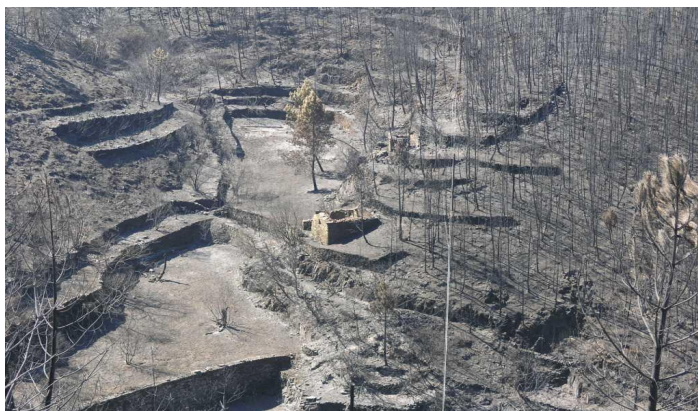
Figura 2: Os incêndios florestais aceleram a degradação das estruturas de conservação do solo usadas na agricultura de montanha. O colapso destas estruturas pode originar fenómenos em cadeia de consequências potencialmente graves e com elevados custos.

A amplitude deste movimento no seguimento das leis de 1889 e 1899 é difícil de avaliar com exactidão, mas não há dúvida de que foi substancial. Enquanto nos distritos de Beja e Évora se semeavam 214.000 ha de trigo em 1910, podemos supor com segurança que a área correspondente durante a década de 1880-90 não poderia estar longe da marca dos 73.000 ha. Estes números, porém, dão apenas uma indicação da rapidez do arroteamento então em curso. A área efectivamente arrancada à charneca foi consideravelmente maior que essa, devido ao facto de o trigo ser cultivado numa rotação que incluía não só outros cereais, mas também anos de pousio, não raro dois ou três."