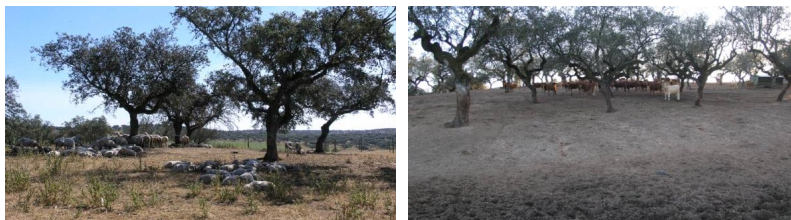
Figura 3: Como equilibrar a pecuária extensiva (ovelhas, vacas, porcos) com a sustentabilidade do coberto arbóreo em montados de sobre e azinho?

Embora os dados do INE (GPPAA, 2009) não indiquem uma variação sensível das áreas totais de culturas permanentes à escala nacional, é bem conhecido o investimento em novas vinhas e olivais um pouco por todo o país. Os dados estatísticos sugerem que esses investimentos se fizeram em áreas já anteriormente ocupadas por culturas permanentes, ou que as novas áreas não ultrapassaram as que formam entretanto abandonadas, por exemplo, com os incentivos ao abate de olivais velhos. Apesar destas culturas permanentes não terem o mesmo historial de degradação do solo como as culturas anuais, não é difícil encontrar, também nestas culturas, evidências de processos de degradação, principalmente por erosão hídrica, em resultado de erros de instalação e/ou de condução (Figura 4).