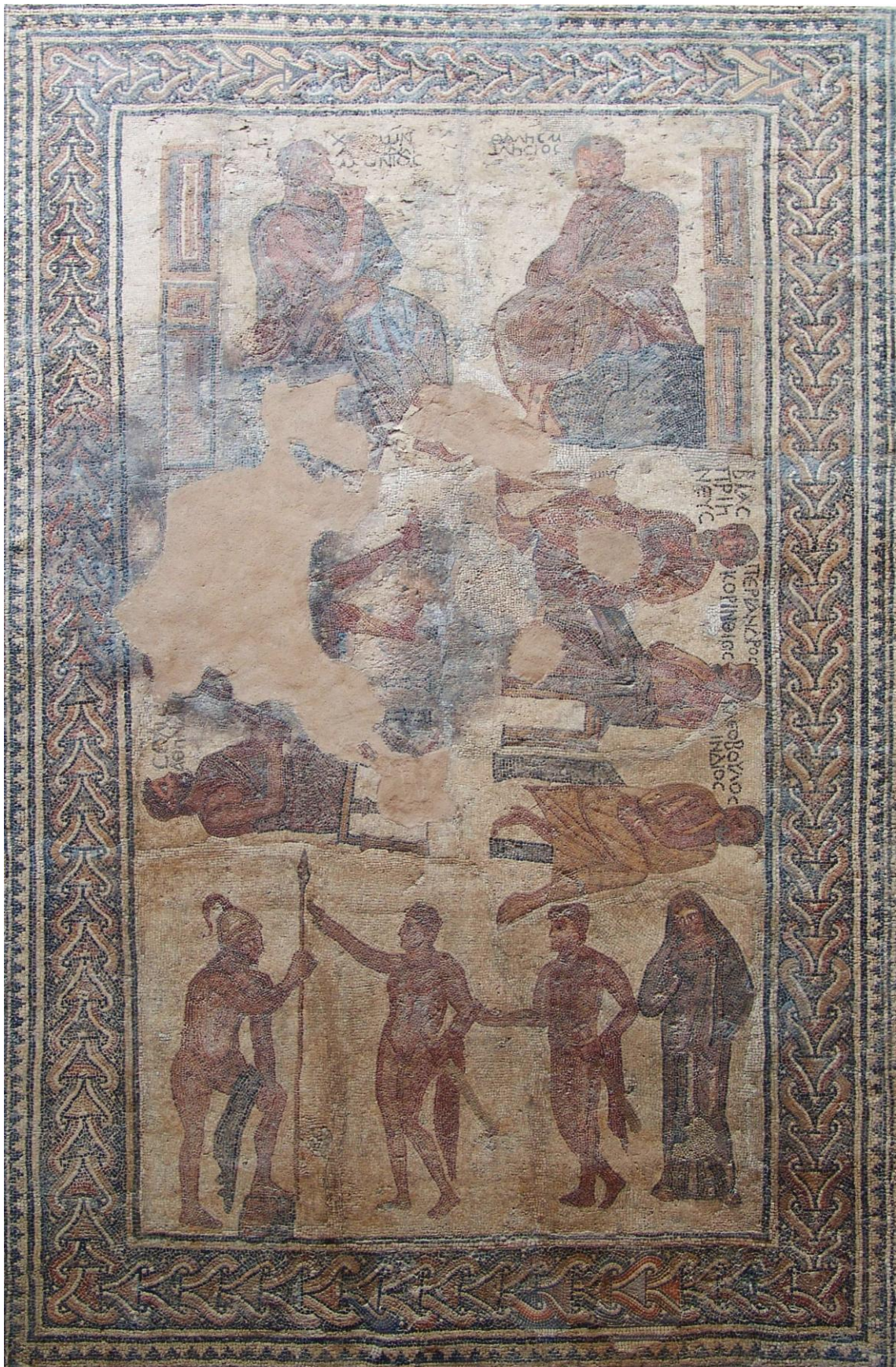
Fig.12 – Mosaico dos “Sete Sábios”. Panorama Geral.