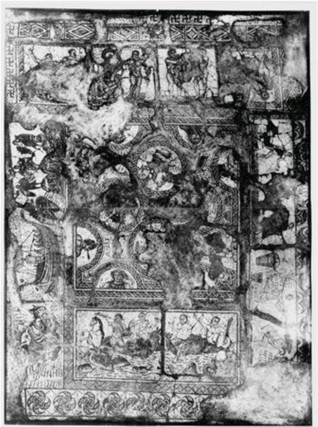
Fig.15 - Mosaico da villa de Santa Vitória do Ameixial, Estremoz. Panorama Geral.