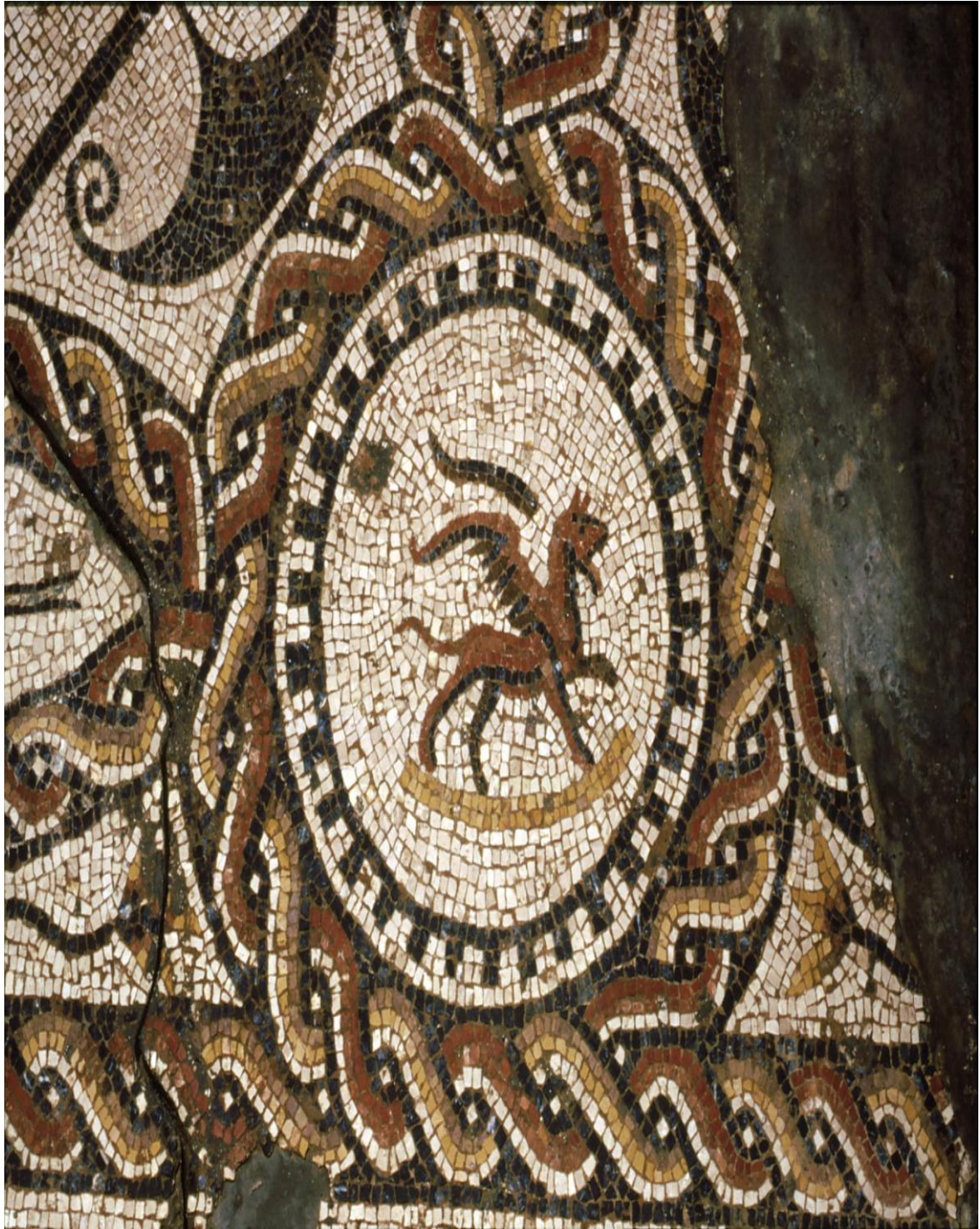
Fig.1 - Mosaico de Orfeu da villa romana da Ermita de la Piedad. Pormenor do grifo.