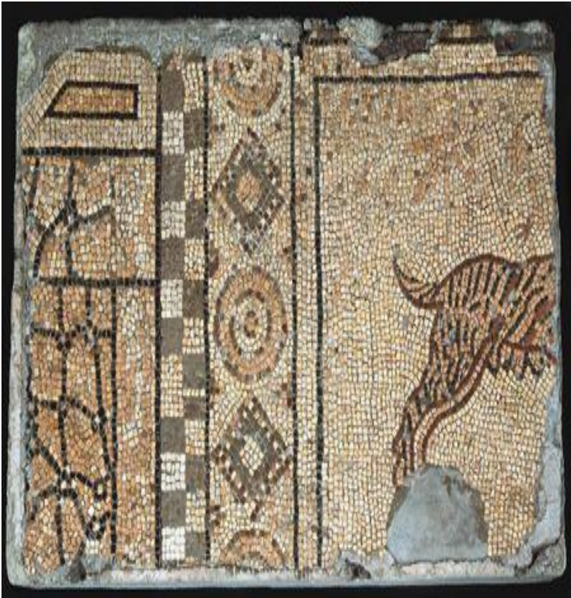
Fig. 8 - Mosaico da villa romana de Martim Gil, Leiria. Pormenor da moldura que enquadra Orfeu e os animais.