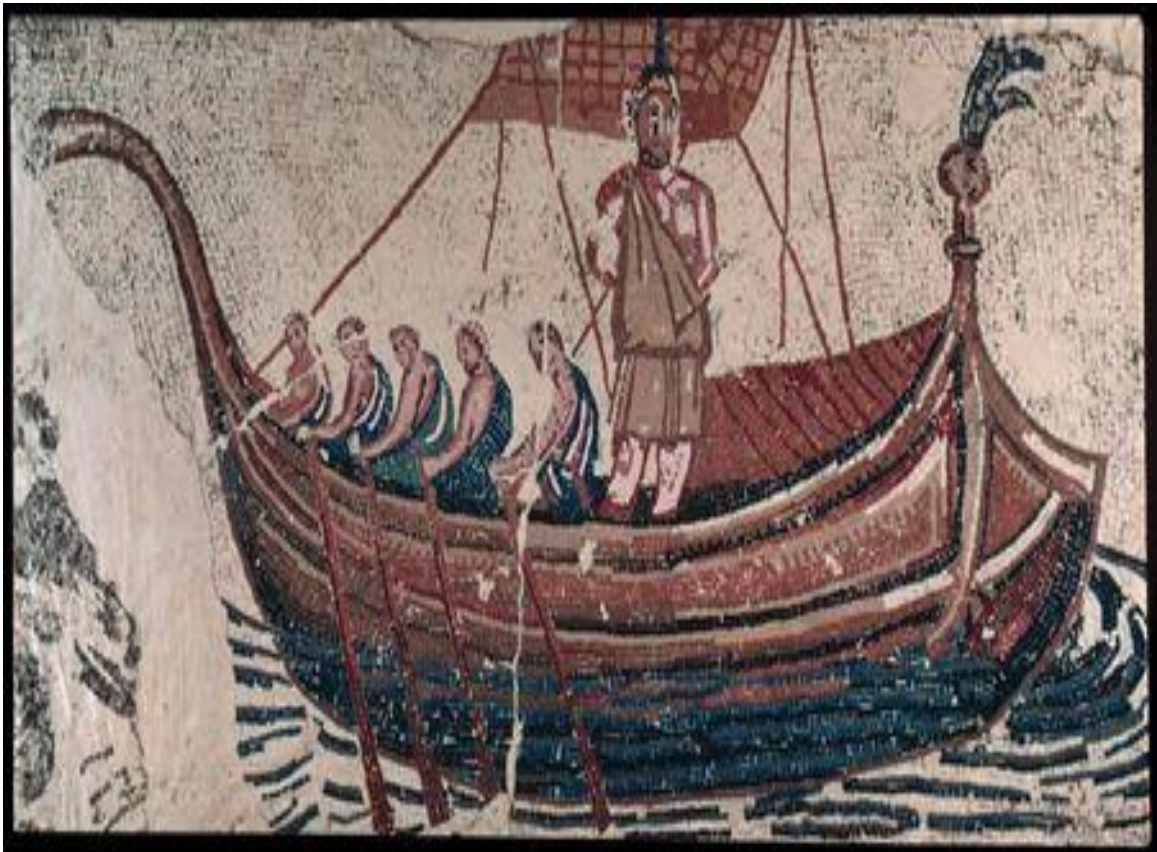
Mosaico da villa romana de Santa Vitória do Ameixial, Estremoz. Pormenor do barco de Ulisses e seus tripulantes (foto superior – fig.13 ) e pormenor das sereias (foto inferior – fig.14 ).