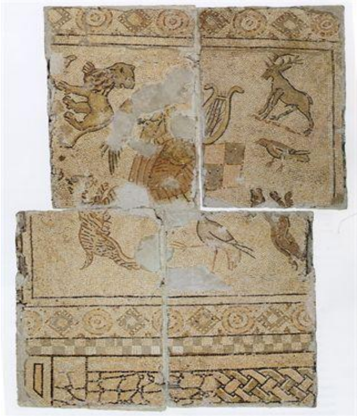
Fig. 7 - Mosaico da villa romana de Martim Gil, Leiria. Pormenor dos animais.