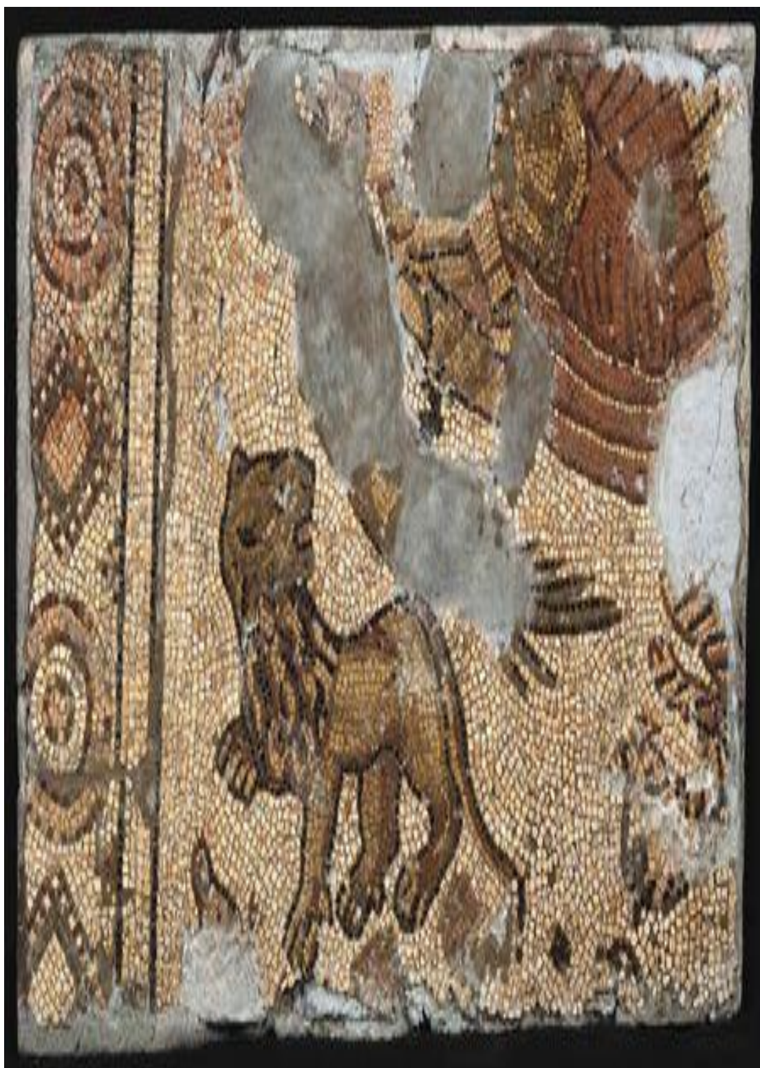
Fig. 9 - Mosaico da villa de Martim Gil, Leiria. Pormenor do leão.