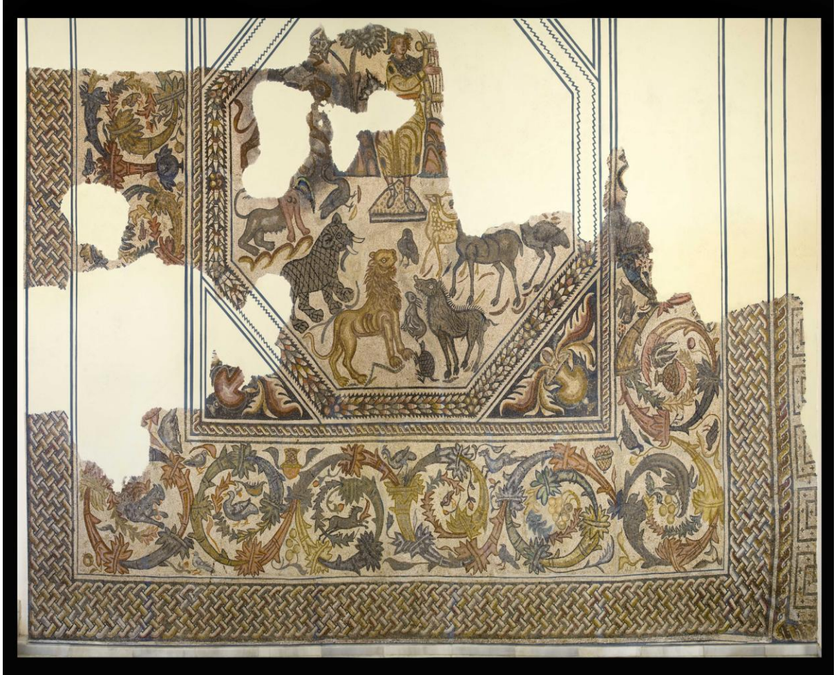
Fig.4 - Mosaico da villa romana de “El Pesquero”. Panorama Geral.

Museo Arqueológico Provincial de Badajoz.