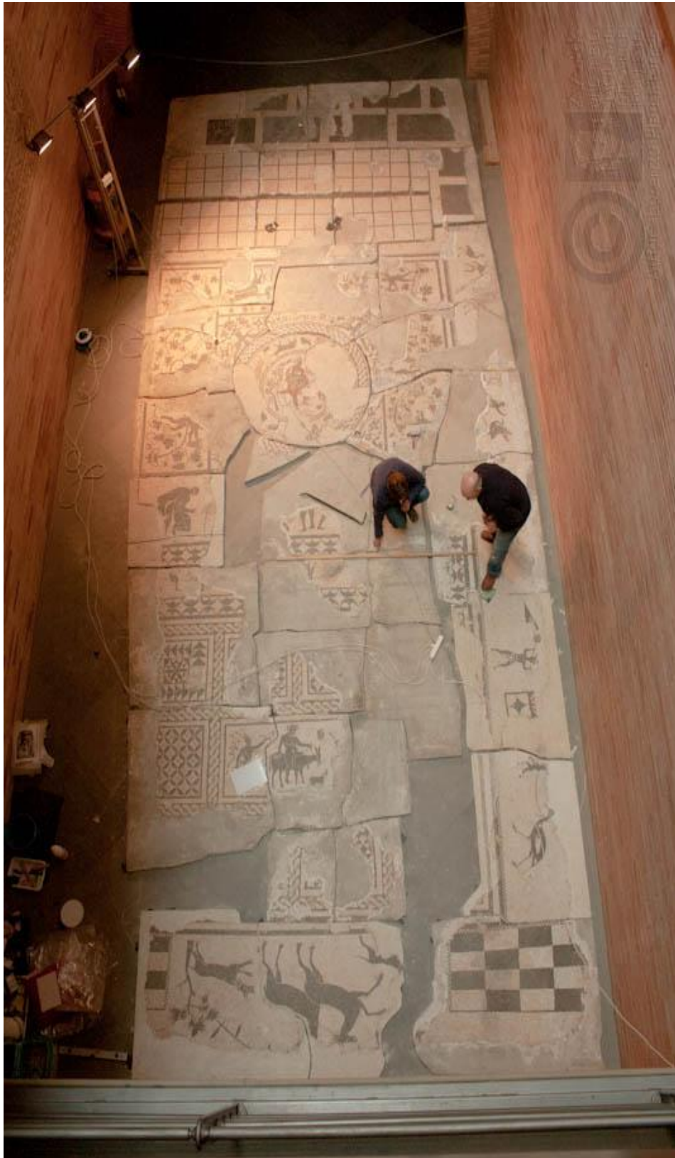
Fig.3 - Restauração do mosaico da Travesía de Pedro María Plano.