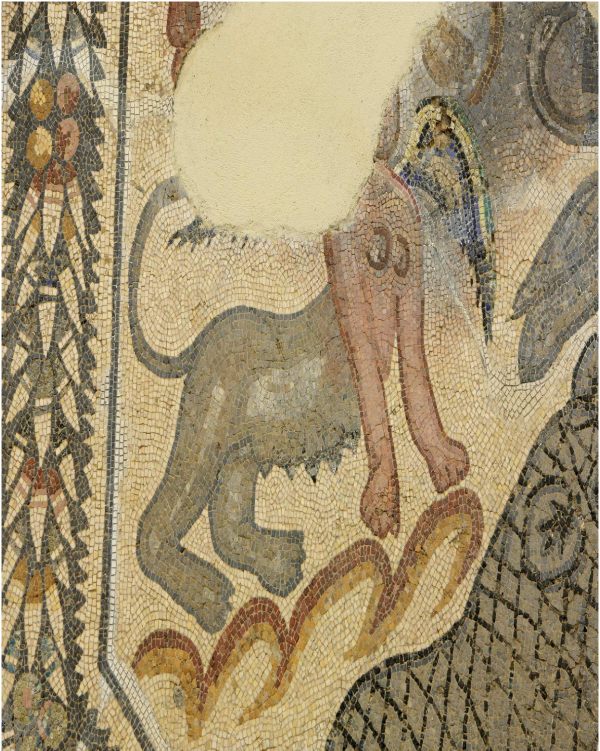
Fig.6 - Mosaico da villa de “El Pesquero”. Pormenor da esfinge. Museo Arqueológico Provincial de Badajoz.