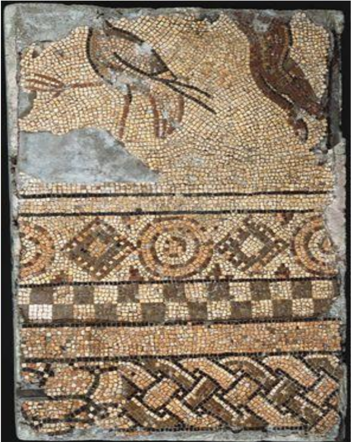
Fig.11 –Mosaico da villa de Martim Gil. Pormenor da moldura.