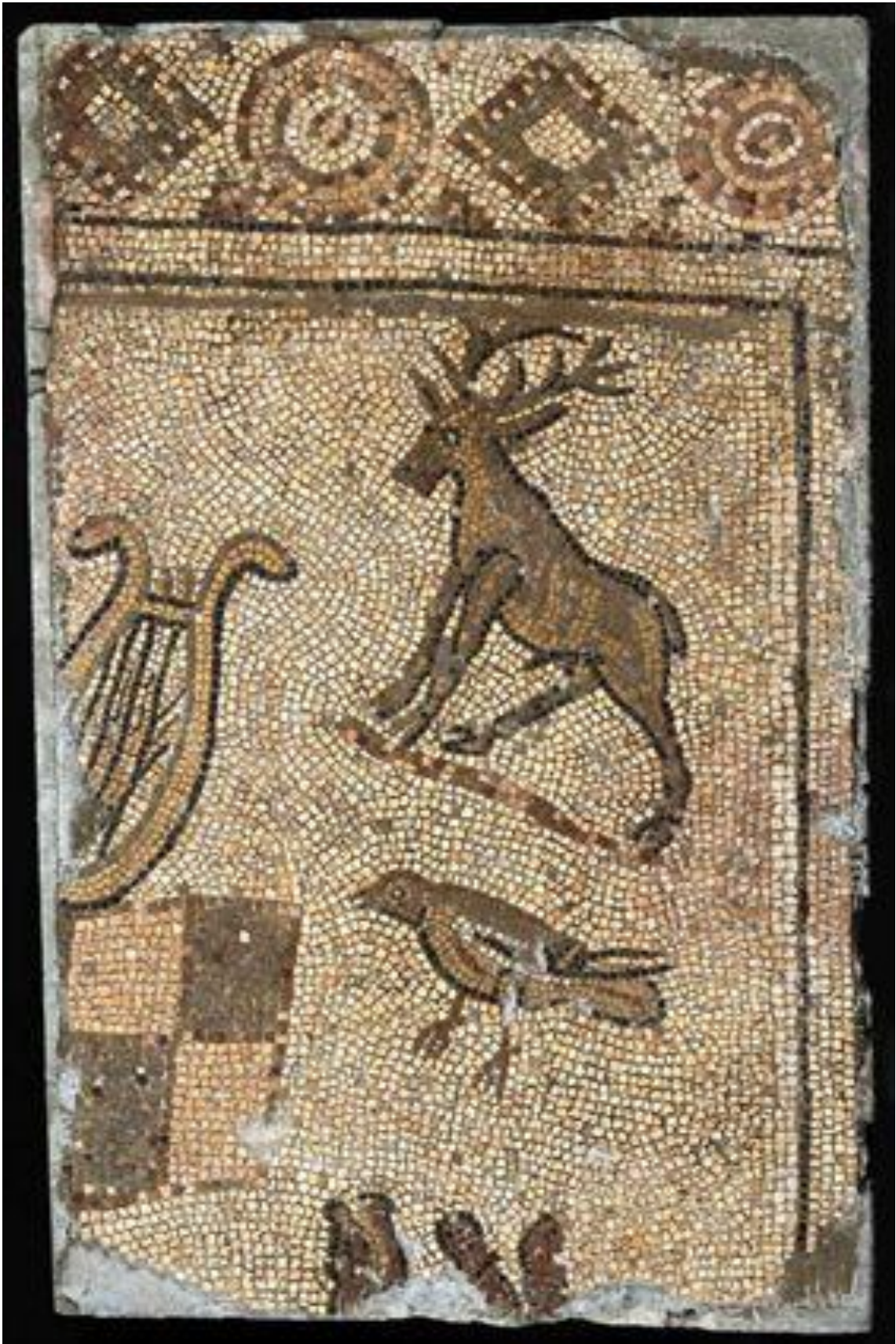
Fig. 10 – Mosaico da villa de Martim Gil. Pormenor da lira de Orfeu e dois animais.