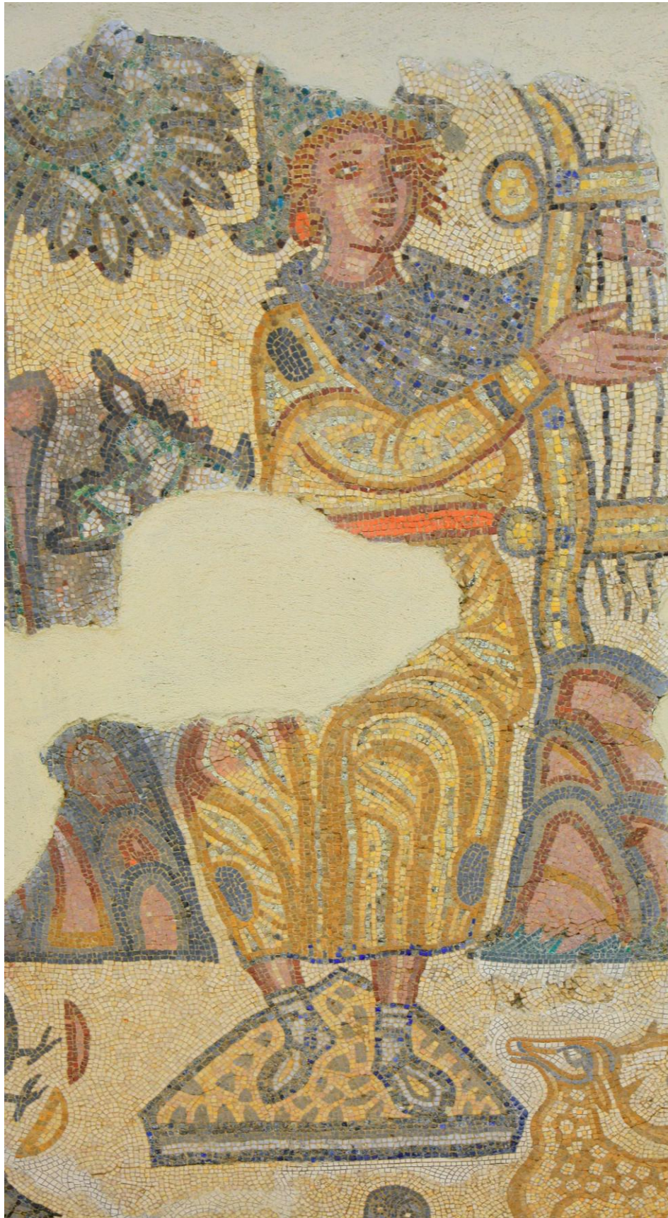
Fig.5 - Mosaico da villa romana de “El Pesquero”. Pormenor de Orfeu. Museo de Badajoz.