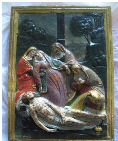
Após a intervenção(2012)