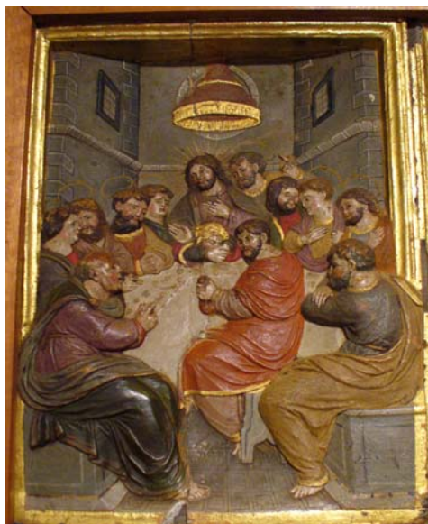
Antes da Intervenção (2006)