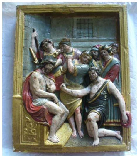
Após a intervenção(2012)

Pormenor da reconstituição e reintegração cromática da moldura. No pormenor podemos ver que não foi feita a reintegração volumétrica da lança que está na mão de Cristo.