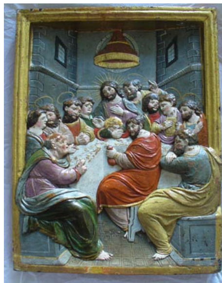
Após a intervenção(2012)

Pormenor da reconstituição e reintegração cromática.