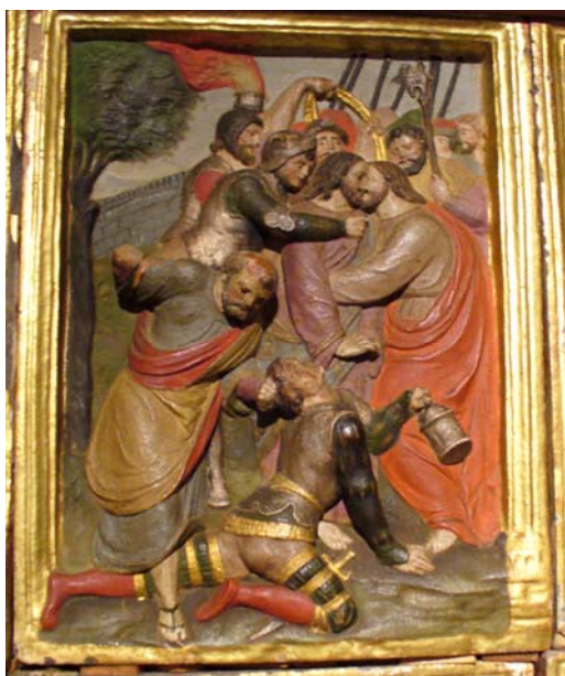
Antes da Intervenção (2006)