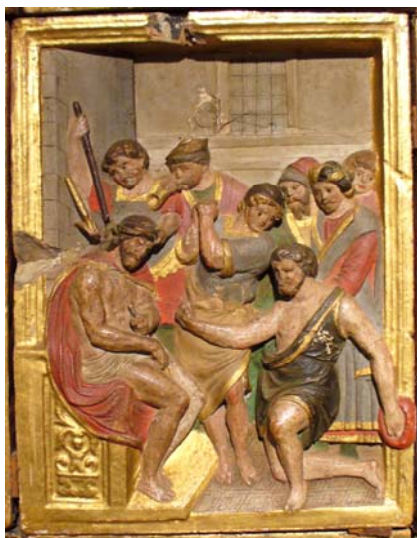
Antes da Intervenção (2006)