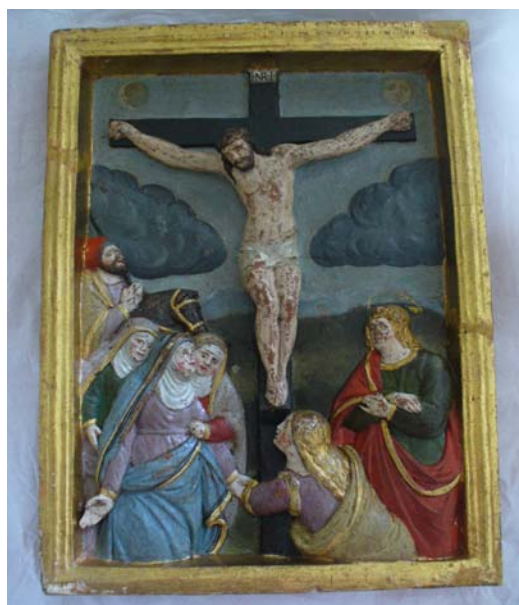
Após a intervenção(2012)

Pormenor dos preenchimentos volumétricos e da reintegração cromática.