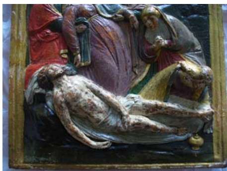
Pormenor da reintegração cromática.