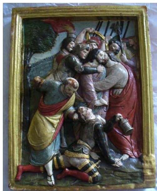
Após a intervenção(2012)

No pormenor podemos ver que não foi reconstituído volumetricamente o braço direito do apóstolo.