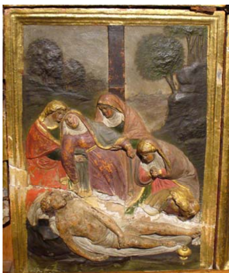
Antes da Intervenção (2006)