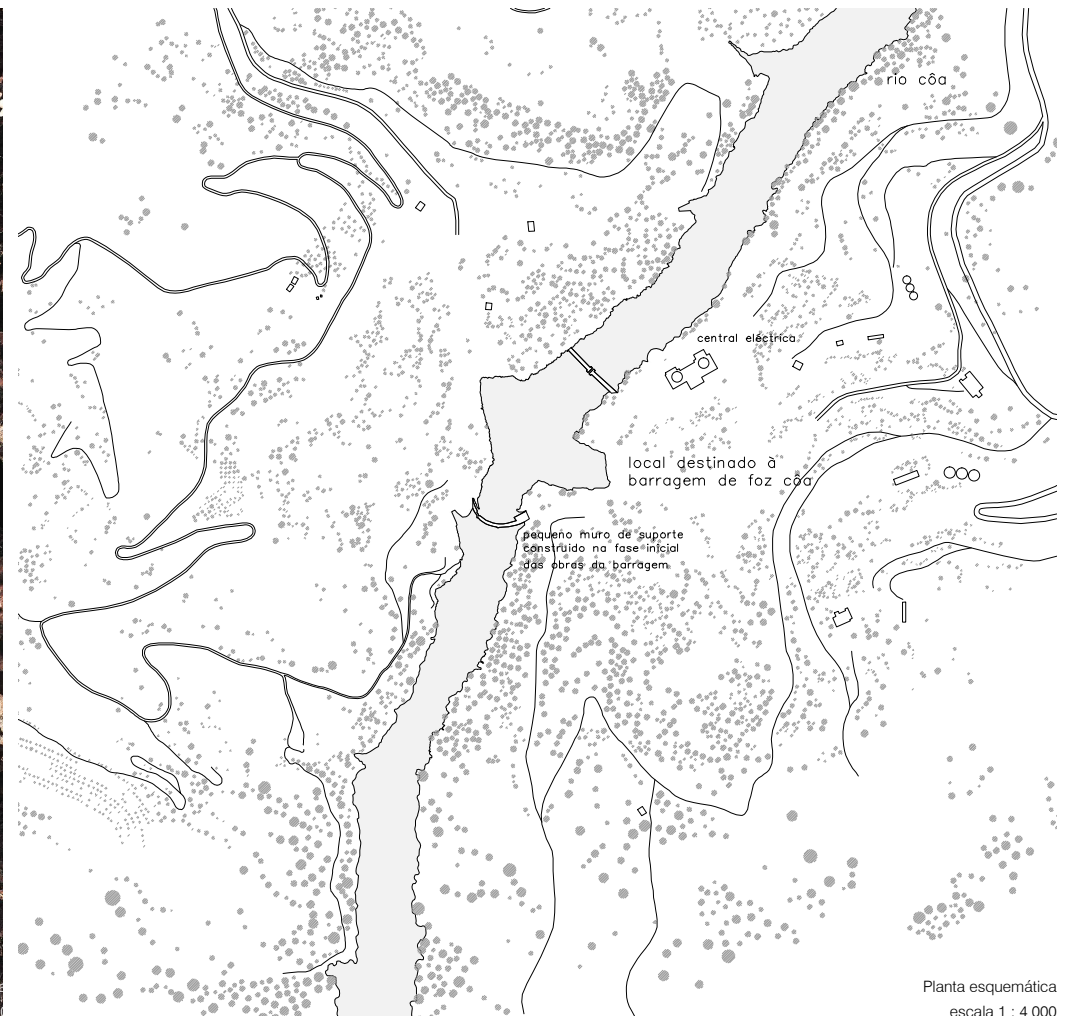
Planta esquemática escala 1 : 4 000