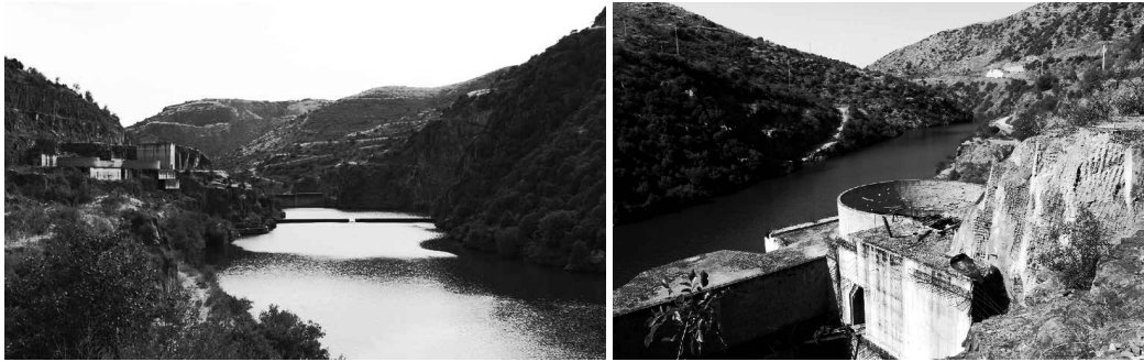
Fig. 34 e 35 Barragem de Foz Côa