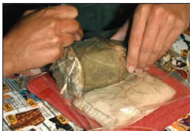
Figura 5 - Desenho dos fragmentos, sobre película

De seguida, com o apoio de uma fina película de plástico, desenharam-se todos os fragmentos existentes (Fig. 5).