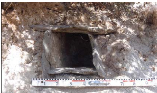
Figura 1 - Vista de uma das sepulturas, em corte

esvaziadas (Fig.1), provavelmente devido à acção de escavadores clandestinos e uma terceira começava a aflorar, na margem vertical da ribeira.