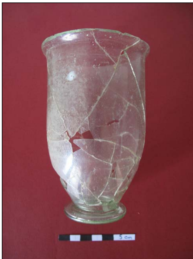
Figura 10 - Copo de vidro, após restauro.