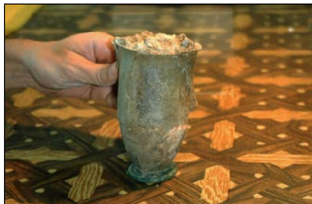
Figura 4 - Vista inicial do copo

No Laboratório de Conservação e Restauro do Museu Monográfico de Conímbriga procedeu-se, numa primeira fase, à limpeza do copo, pelo exterior (Fig. 4).