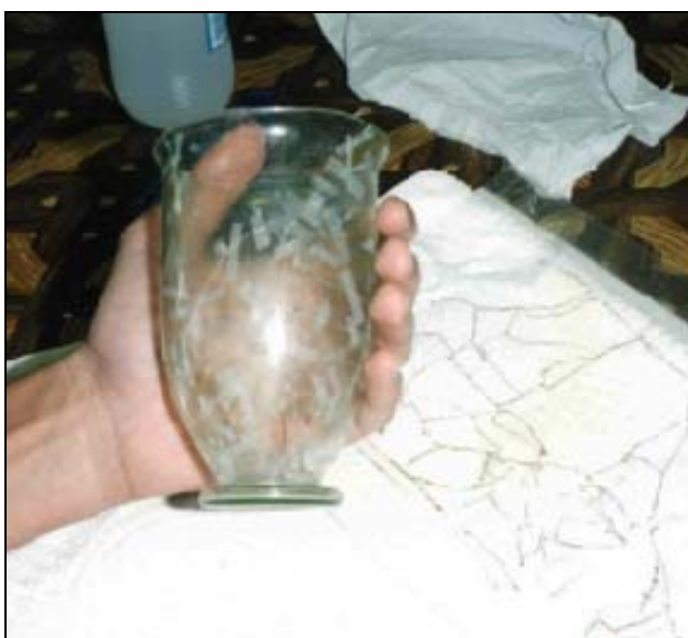
Figura 9 - Vista final do copo, em restauro

Posteriormente o copo foi estabilizado com um colante apropriado a este tipo de vidros.