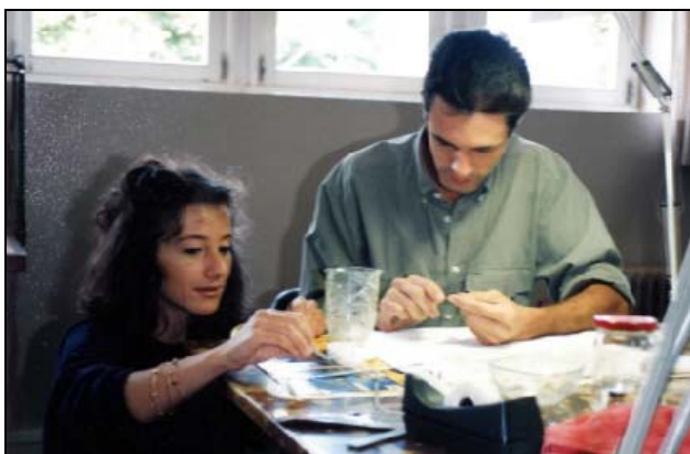
Figura 8 - Remontagem do copo

A fase seguinte consistiu em lavar todos os fragmentos e proceder à sua remontagem (Fig. 8 e 9).