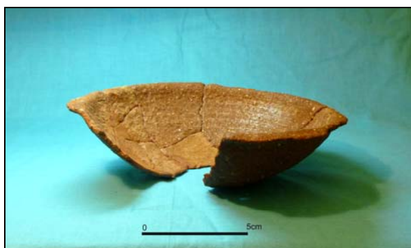
Figura 11- Vista final da taça, após restauro

Estando rodeado de casais de segunda ordem de grandeza, a questão relevante a esclarecer reside no modo como surge em Poço do Cortiço um copo de vidro, peça que representa sempre um investimento de alguma dimensão, quando os pontos de povoamento correspondentes parecem ser locais de pouca expressão sócio-económica.