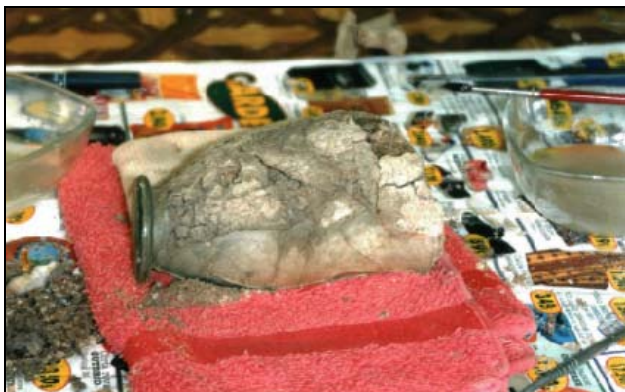
Figura 7 - Pormenor do copo em restauro