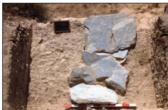
Figura 3 - Pormenor das tampas [4]

O topo da sepultura [4] encontrava-se ligeiramente inclinado para SE. A tampa era composta por duas lajes de xisto de maiores dimensões, uma em cada topo, tendo a parte mesial várias lajes de menores dimensões, algumas das quais partidas in situ , provavelmente devido ao abatimento da sepultura para Sul (Fig. 3).