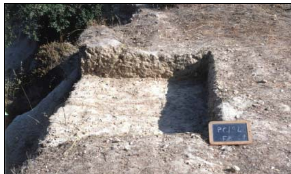
Figura 2 - Pormenor da escavação

A escavação veio a revelar-se extremamente difícil devido às características geológicas da área. De facto, o depósito de calhaus de quartzo e quartzito, de diferentes dimensões, associado a um areão esbranquiçado, era muito compacto e que, na prática, correspondiam a três das unidades identificadas [0], [1] e a [3].