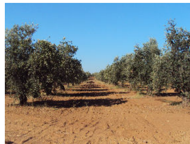
Olival em solos férteis