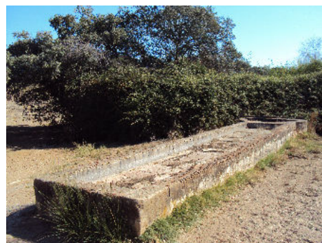
Bebedouro junto ao poço da cegonha