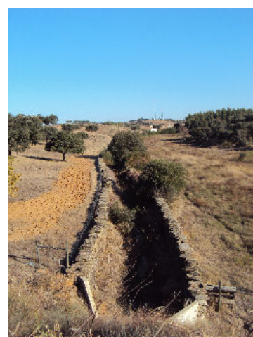
Caminho visto a partir da Circular Sul a Mourão