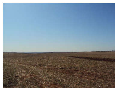
Campos abertos de cerealíferas