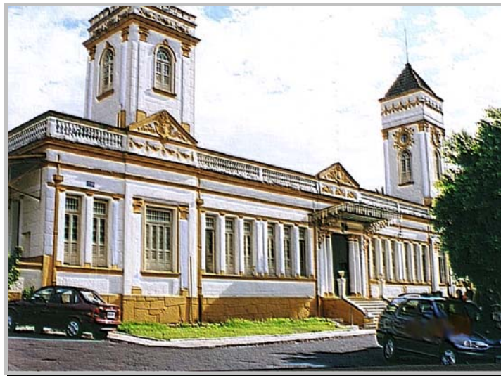
FIGURA 1 - Fachada frontal do edifício, em estilo neoclássico.

A Fundação tem um caráter público e exerce as funções de uma Secretaria Municipal de Cultura. A sua Missão é proteger o patrimônio cultural da cidade de Araxá (MG), resgatando e incentivando as manifestações originais locais, por meio do apoio dado aos seus artistas e escritores.