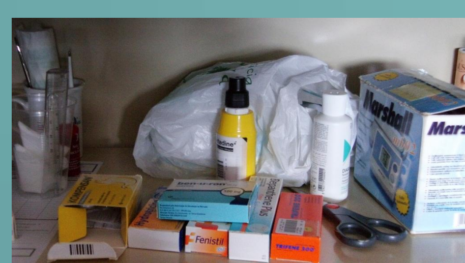
Alguns dos materiais existentes no armário de primeiros-socorros