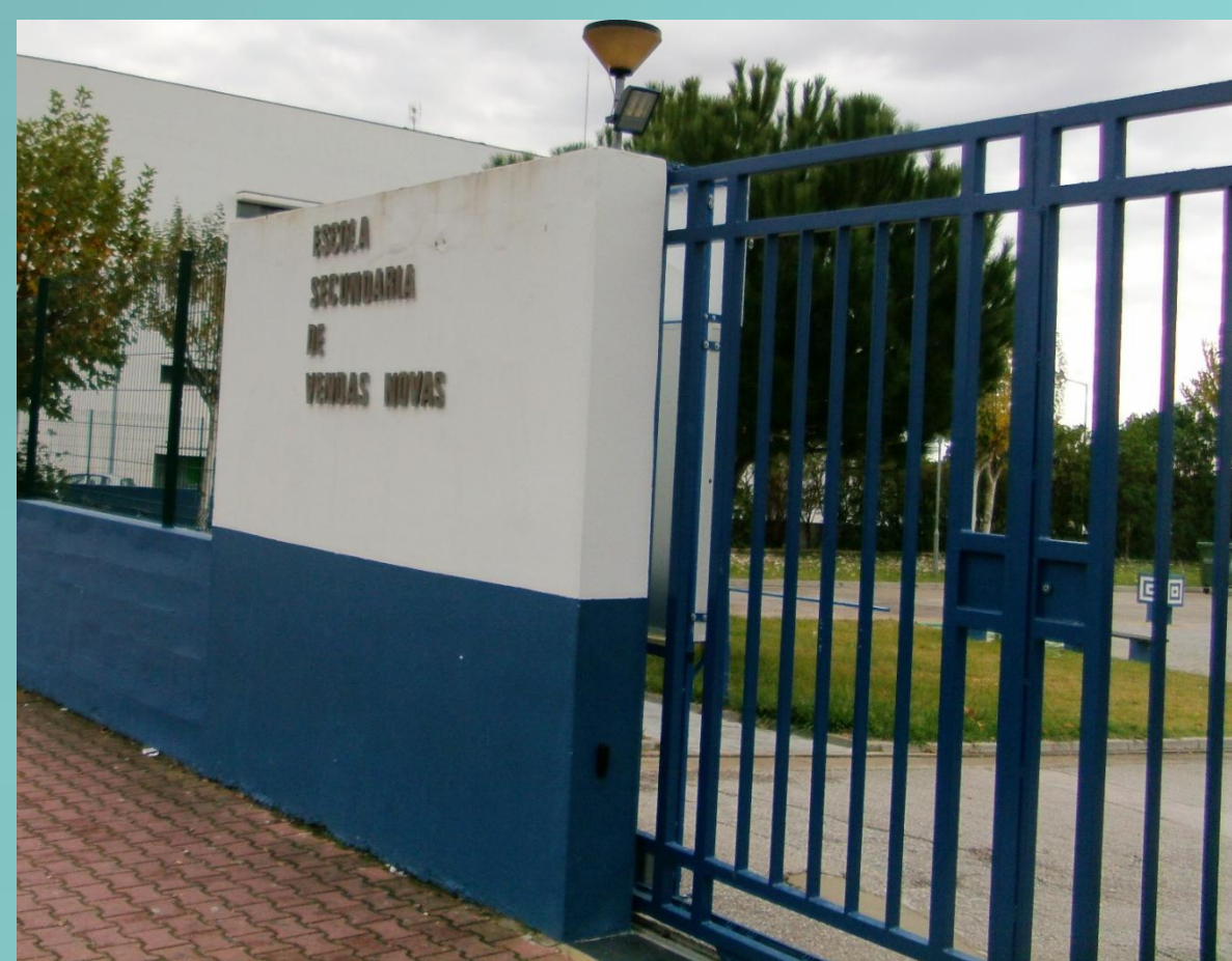
Vista da entrada principal

No que diz respeito às escolas, o Ministério da Educação (2010) considera que a segurança “deve ser uma preocupação comum a todos os membros da comunidade educativa – pessoal docente e não docente, alunos, pais, encarregados de educação e representantes autárquicos”. Este trabalho centra-se na caracterização da cultura de segurança da Escola Secundária com 3.º Ciclo do Ensino Básico de Vendas Novas, que se destaca por registar um número muito reduzido efectivo de acidentes. Caracteriza a cultura de segurança no que diz respeito aos planos de segurança e emergência, acção e evacuação, assim como os canais de primeiros socorros e formação específicos dos agentes educativos para a actuarem nesta dimensão.