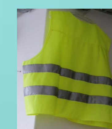
Colete reflector existente em todas as salas de aula

Em matéria de acidentes, na ESVN houve uma média de 0,013 por aluno, o que revela, comprovadamente, a decisão das medidas adoptadas pela escola relativamente à segurança e o comportamento dos alunos e dos agentes educativos numa cultura de prevenção. A dedicação e o investimento são elevados, exigem envolvimento de todos, mas os resultados são de facto bastante animadores, sendo a ESVN um caso de sucesso na prevenção da segurança em meio escolar.