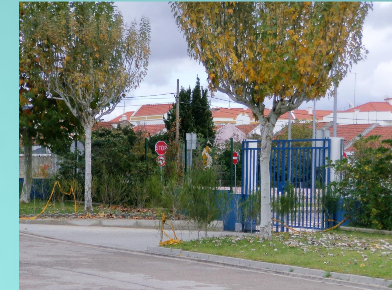
Vista da entrada lateral