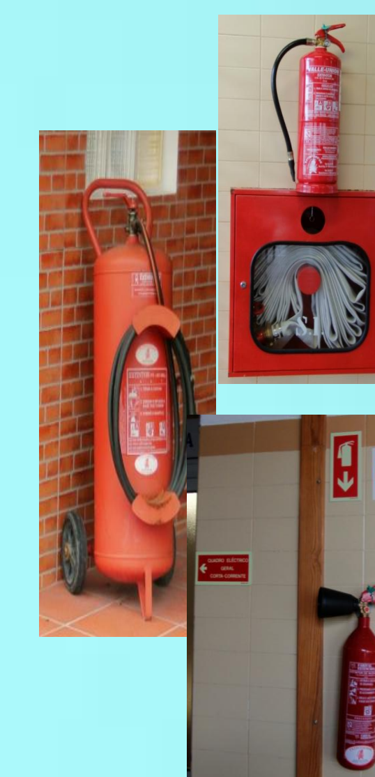
Meios de combate a incêndios