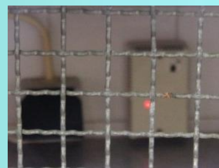
Detector de gás