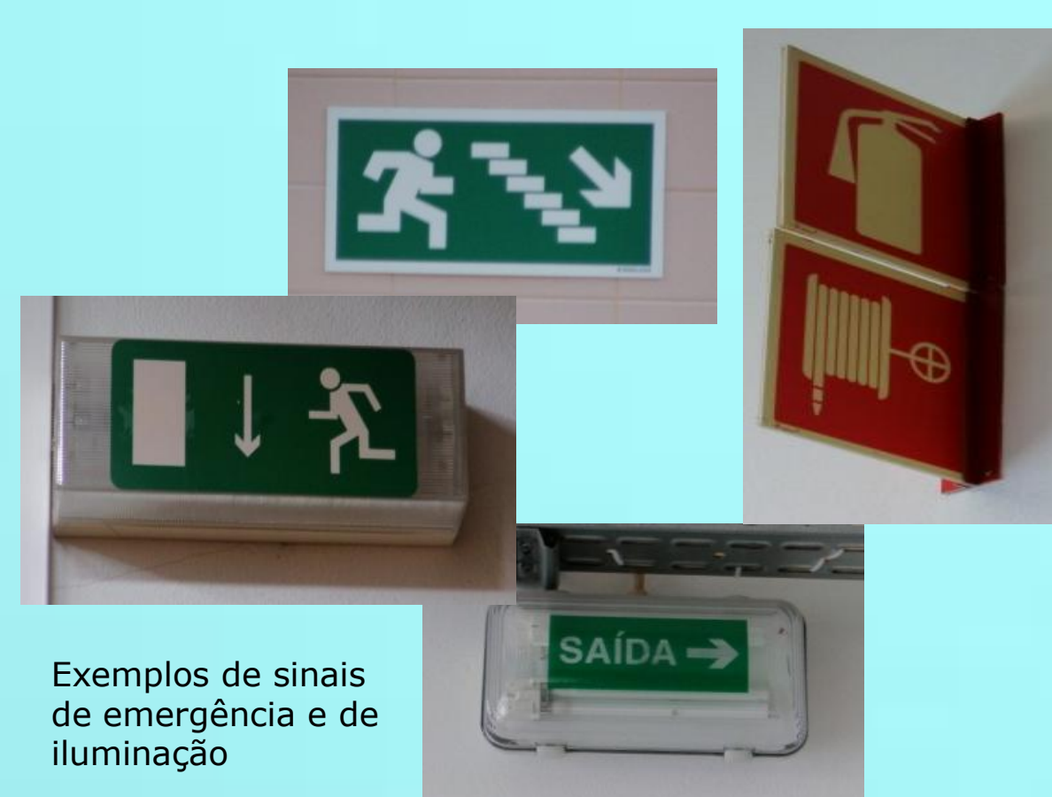
Exemplos de sinais de emergência e de iluminação