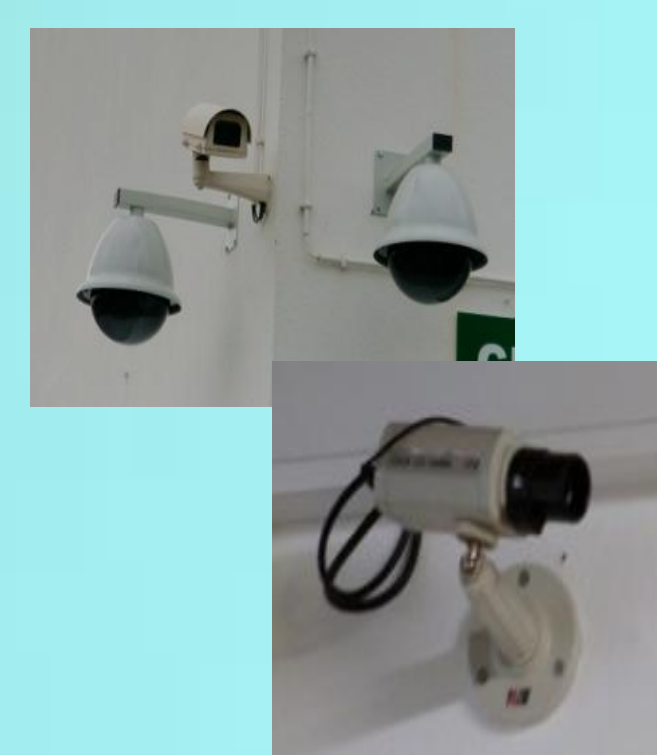
Câmaras de videovigilância