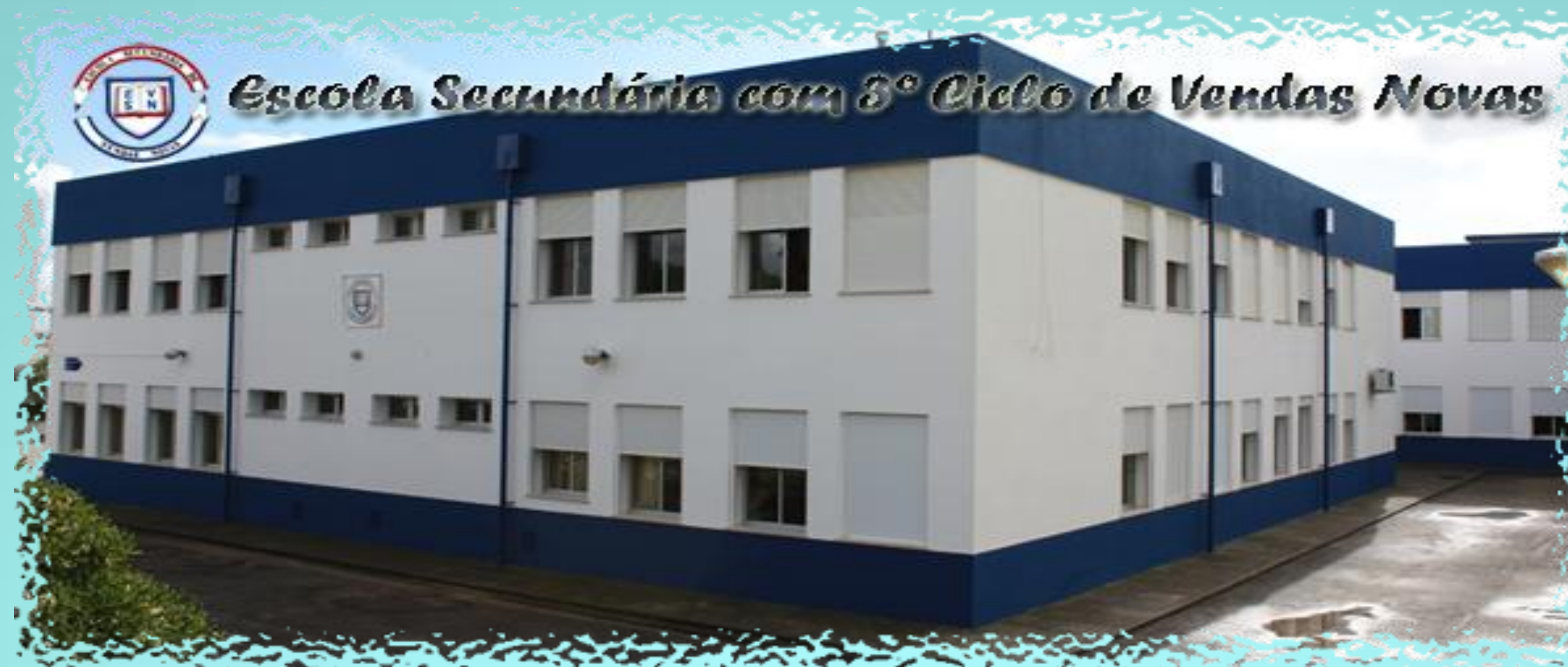
Vista da fachada do edifício principal da Escola Secundária de Vendas Novas