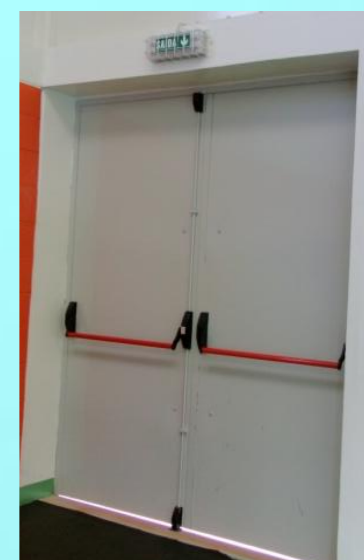
Saída de emergência devidamente desobstruída e correctamente assinalada.