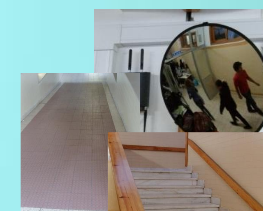
Segurança na circulação de pessoas: espelhos, corrimões, pavimentos anti-derrapantes