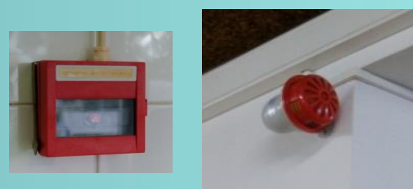
Alarme de incêndio e sirene interior