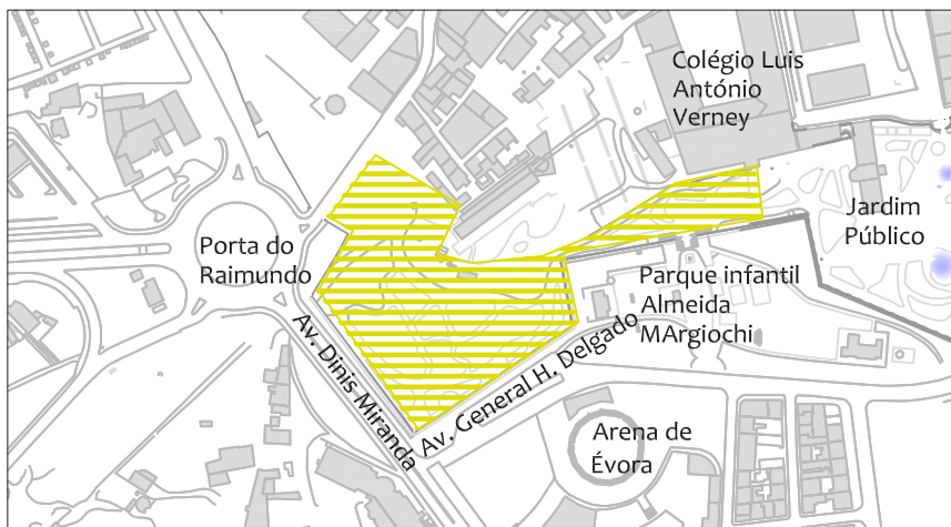
PLANTA DE LOCALIZAÇÃO NO TECIDO URBANO 1:5 000

EQUIPAMENTOS, INFRA-ESTRUTURAS E MOBILIÁRIO: PAPELEIRAS, MESAS E BANCOS