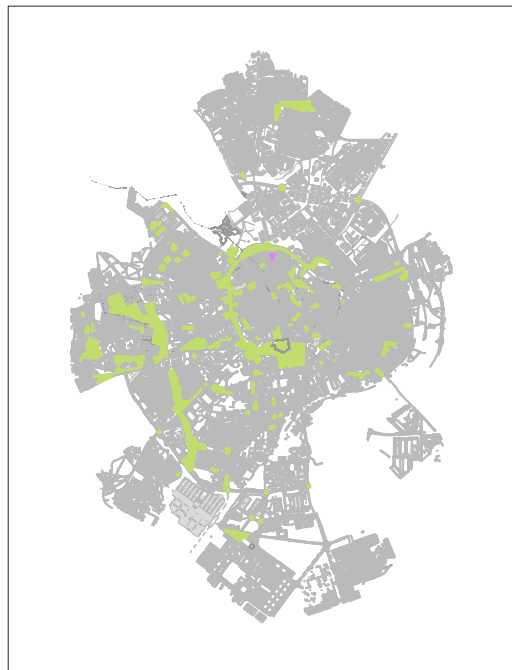
PLANTA DE LOCALIZAÇÃO NO PERÍMETRO URBANO 1:80 000