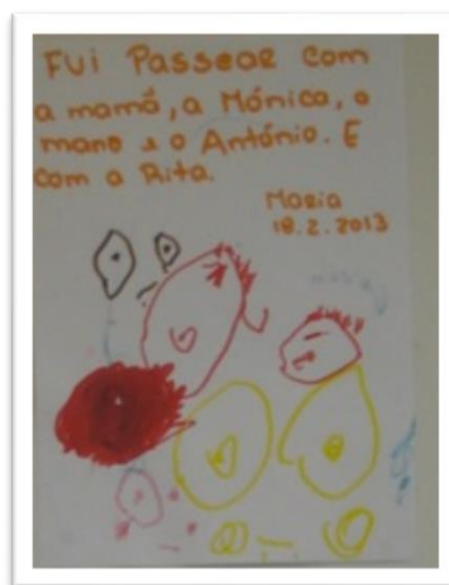
Fotografia 4 - Momento de escrita da M. (3:00).

São capazes realizar uma atividade direcionada e adequada quando exploram os livros, folheando todas as páginas do livro e imitando os sons relacionados com as imagens que estão a ler. Por exemplo, várias vezes, observei o Mt. (2:5) a folhear um livro e a contar a história. “O Ti. (3:00) folheava as páginas do