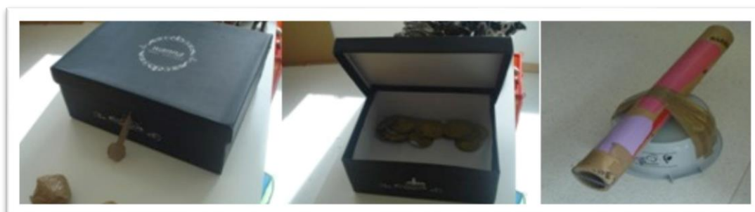
Fotografia 8 - Objetos criados pelas crianças para enriquecerem as suas brincadeiras em torno do castelo.

Do domínio da expressão dramática , as crianças demonstraram interesse pelo jogo simbólico ou o faz-de-conta. Foi através deste interesse das crianças que surgiu o projeto “Construção do castelo”. As brincadeiras das crianças normalmente eram enriquecidas com adereços da área do faz de conta, com adereços construídos pelas crianças (no caso das brincadeiras relacionadas com o projeto “Construção do castelo”). Eram igualmente enriquecidas através da imitação e recriação de situações do quotidiano e ainda através da utilização de diferentes possibilidades de utilização da VOZ.