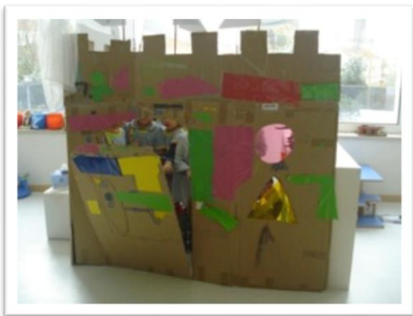
Fotografia 9 - 1º castelo construído

As brincadeiras mais comuns durante a PES foram: as professoras, onde as crianças recorriam muito à área da leitura e da escrita, mais concretamente aos livros, aos cadernos e às canetas; aos castelos, no âmbito do projeto “Construção do castelo”. A construção dos vários adereços veio enriquecer ainda mais essas brincadeiras. “Apresentaram várias propostas e várias ideias, algumas mesmo muito interessantes e criativas, desde um castelo de princesas e outro de guerreiros, a um castelo com uma porta com correntes, a escudos, a torres com escadas, etc.” (in relatório de observação participante em jardim-de-infância II – 2 a 5 abril 2013); aos apicultores, brincadeiras que acabaram por surgirem nas últimas semanas, depois da visita da apicultora, a qual deixou na sala um fato de apicultor e uma colmeia para as crianças poderem brincar.