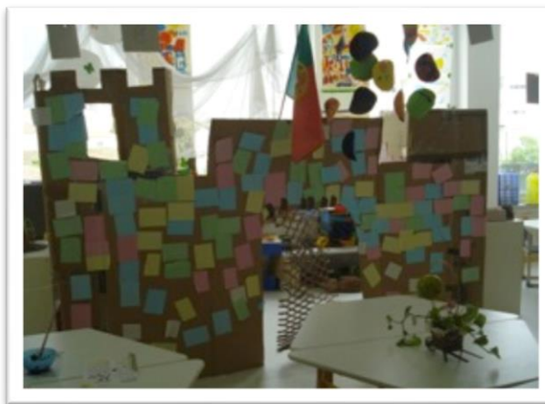
Fotografia 10 - 2º castelo construído

No domínio da matemática as crianças foram construindo algumas noções matemáticas e foram desenvolvendo o pensamento lógico, através das diversas situações do dia-a-dia, ou até mesmo de situações criadas na sala.