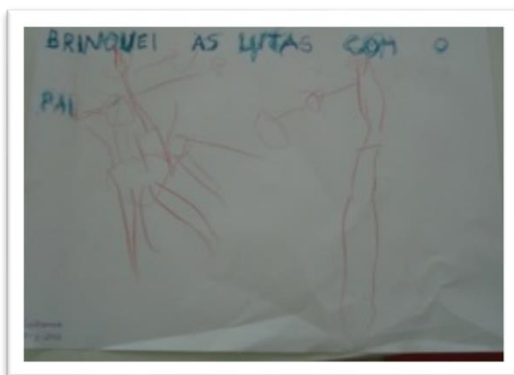
Fotografia 11 - Momento de escrita do G. (4:5)

Já realizam tentativas de escrita através da cópia de palavras e textos, através da identificação das letras em textos escritos, através da escrita no computador. O D. (5:7) e o Ma. (4:2) já realizam tentativas de escrita, onde já apresentam algumas letras do seu nome, e na cópia de textos e palavras, também já se começa a observar a cópia exata de algumas letras. O Pe. (3:4) e o G. (4:5) realizam ainda garatujas.