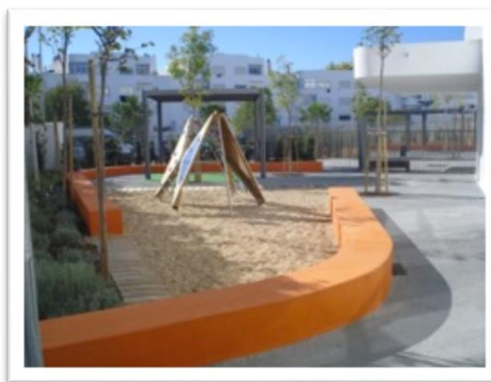
Fotografia 1 - Espaço exterior

Este é composto por espaço exterior e por espaço interior. O espaço exterior inclui um campo de jogos com balizas e cestos de basquetebol, areia, uma horta e dois espaços com equipamentos de jogo e de recreio Apesar de ser um espaço exterior com uma área bastante considerável, ainda é pouco utilizado. No entanto, este aspeto acaba por ser colmatado, com o facto de cada grupo/sala da instituição (berçário, creche e jardim-de-infância) ter uma saída ao exterior uma vez por semana. Para que