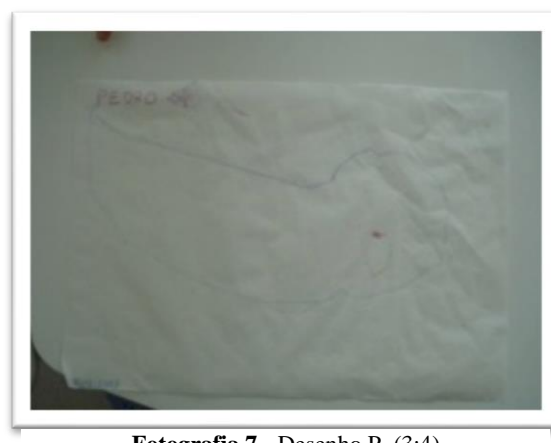
Fotografia 7 - Desenho P. (3:4)

A pintura é uma das atividades preferidas das crianças, no que diz respeito a este domínio, onde já se observam pinturas de cenários realistas, como a L. (5:2), o A. (6:4),