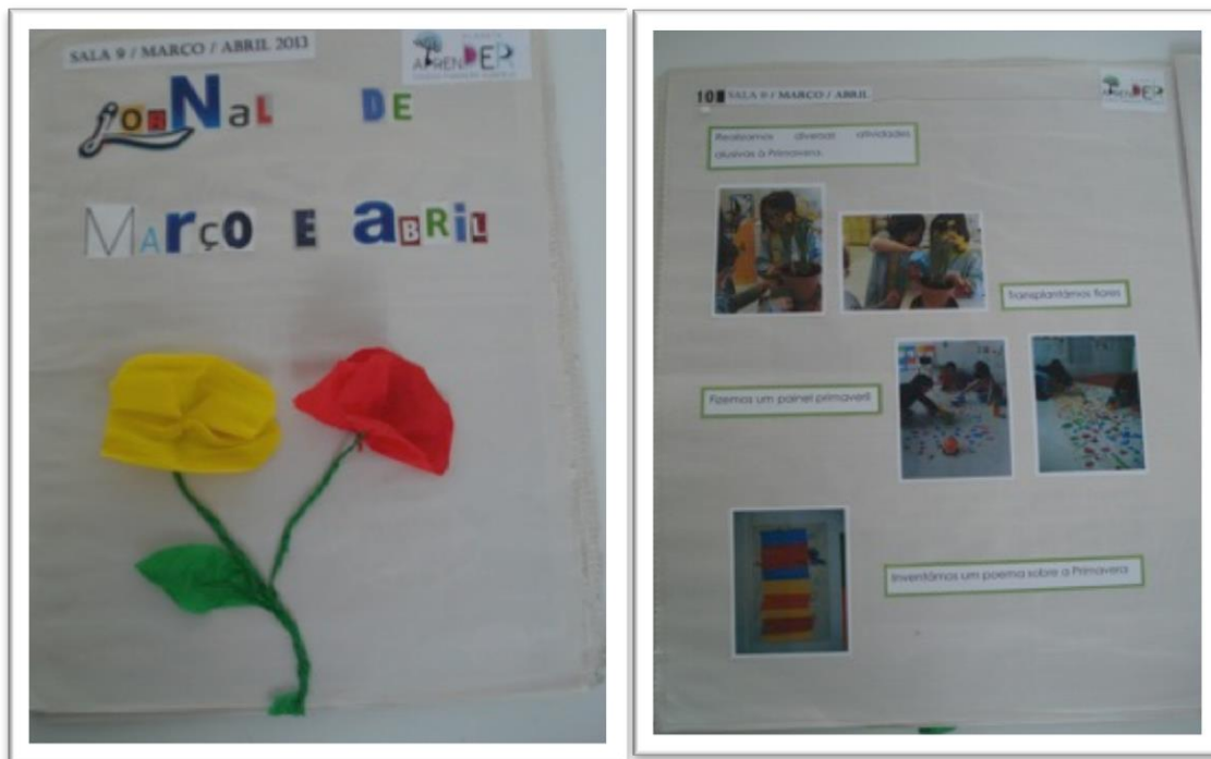
Fotografia 12 e 13 - Jornal mensal

comunicação entre a família e a escola, no sentido em que permite que os pais tenham conhecimento de como é a “vida” na sala.