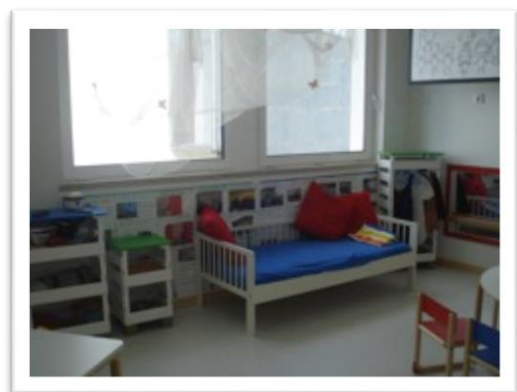
Fotografia 5 - Área do faz de conta (quarto)

Ao longo da PES as crianças demonstraram também interesse pela música, pela história “Viva o peixinho”, pela elaboração de panfletos para entregarem na Epral. Interesses esses que deram origem a pequenos projetos, como “Construção de um aquário com os peixes da história Viva o