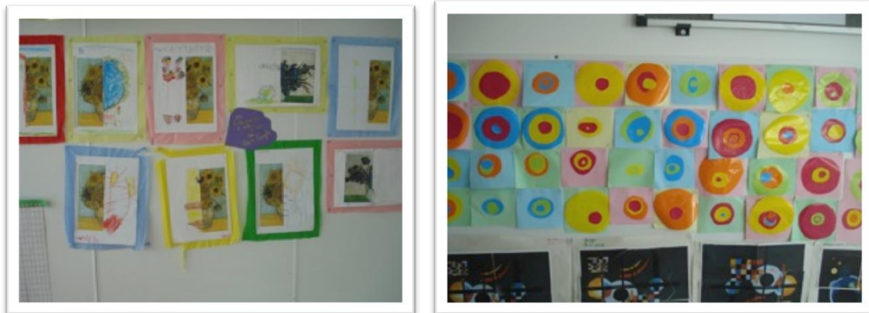
Fotografia 14 e 15 - Produções das crianças afixadas nas paredes da sala de jardim-de-infância

da sala de jardim-de-infância para expor as produções das crianças, como se pode comprovar nas fotografias 14 e 15.