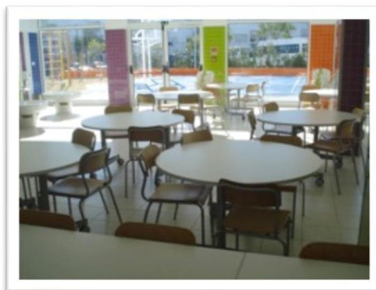
Fotografia 3 - Refeitório

O primeiro andar corresponde à valência de Jardim-de-infância e é composto por três salas de atividades para crianças dos 3 aos 5 anos de idade. Dispõe de duas casas de banho para as crianças, uma casa de banho para os funcionários e ainda uma arrecadação. Cada sala de jardim-de-infância tem um(a) educador(a) e uma auxiliar de ação educativa. Este andar denomina-se “Planeta aprender”.