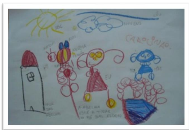
Fotografia 6 - Desenho C. O. (4:7)

No domínio da expressão plástica , ao nível do desenho, algumas crianças ainda realizaram garatujas como o Pe. (3:4) e o G. (4:5). Também já se começam a observar desenhos de algumas crianças, como o A. (6:4), a C. B. (4:9) e a C. O. (4:7) com muitos pormenores e muitas cores.