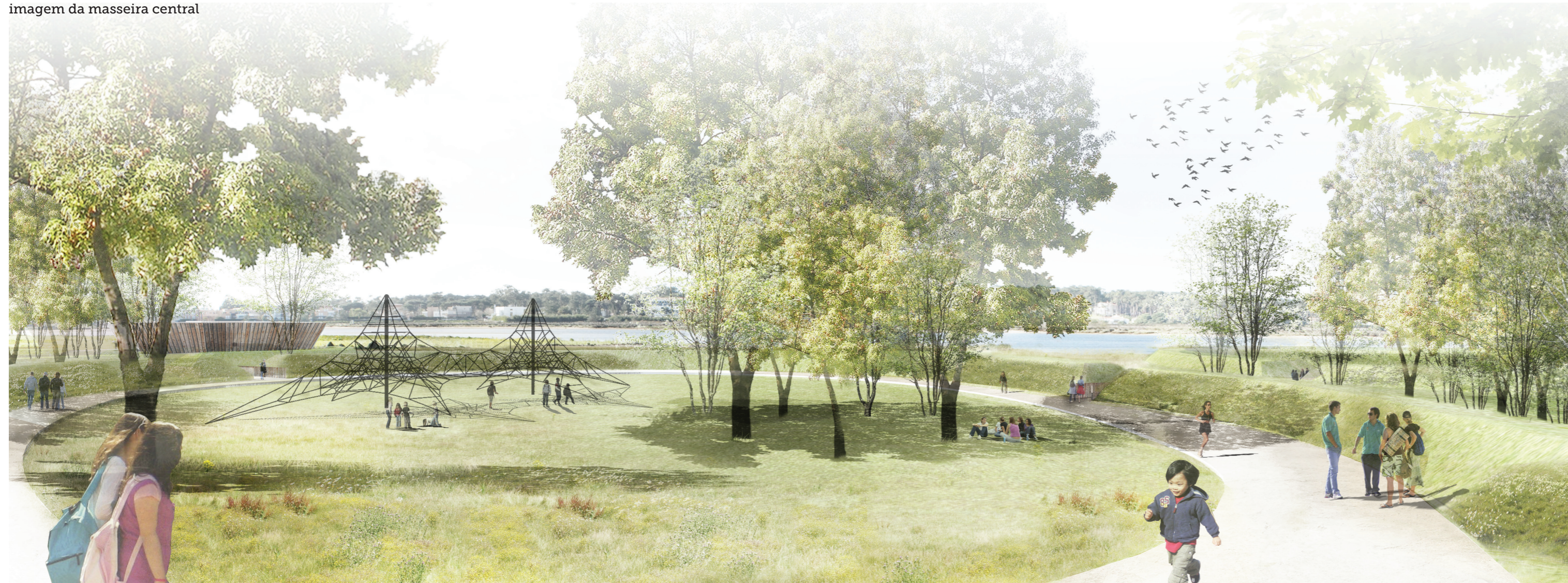
imagem da masseira central