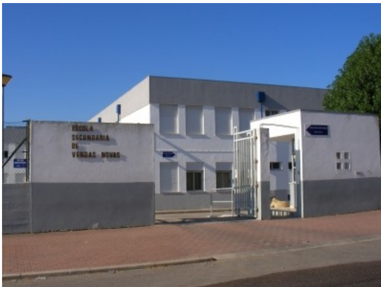
Figura 1. Entrada principal de E SVN.

na Cidade de Vendas Novas, distrito de Évora, está localizada numa área destinada pelo poder local para actividades lectivas, desportivas e de lazer (Figura 1). Fica próxima da estação de camionagem e do Centro de Saúde, bem como de várias valências públicas. Possui boas acessibilidades e boas áreas de estacionamento.