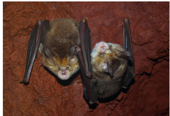
Rhinolophus mehelyi

Espécie colonial estritamente cavernícola, abriga-se em grutas ou em minas de grandes dimensões (Rainho 2013), sendo muito raras as observações noutros abrigos e apenas indivíduos isolados (Dietz et al. 2009). Realiza movimentos regulares entre abrigos de maternidade, hibernação e acasalamento. Em Portugal, a distância máxima percorrida registada foi de 90 km (Palmeirim & Rodrigues 1992). Estudos feitos em vários pontos da sua área de distribuição confirmam que se trata de um especialista em borboletas noturnas (Puechmaille 2020). Na Península Ibérica