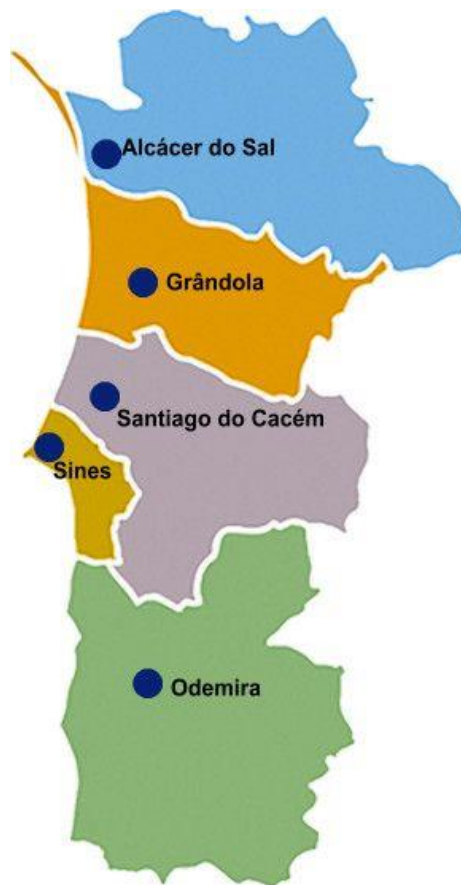
Figura 1. Litoral Alentejano

De acordo com o Instituto Nacional de Estatística (INE), o Índice de envelhecimento nos concelhos de Santiago do Cacém e Grândola são respetivamente 231,6 e 216,3. A densidade populacional no concelho de Santiago do Cacém é de 26,2 hab./km 2 e em Grândola 16,7 hab./km 2 .