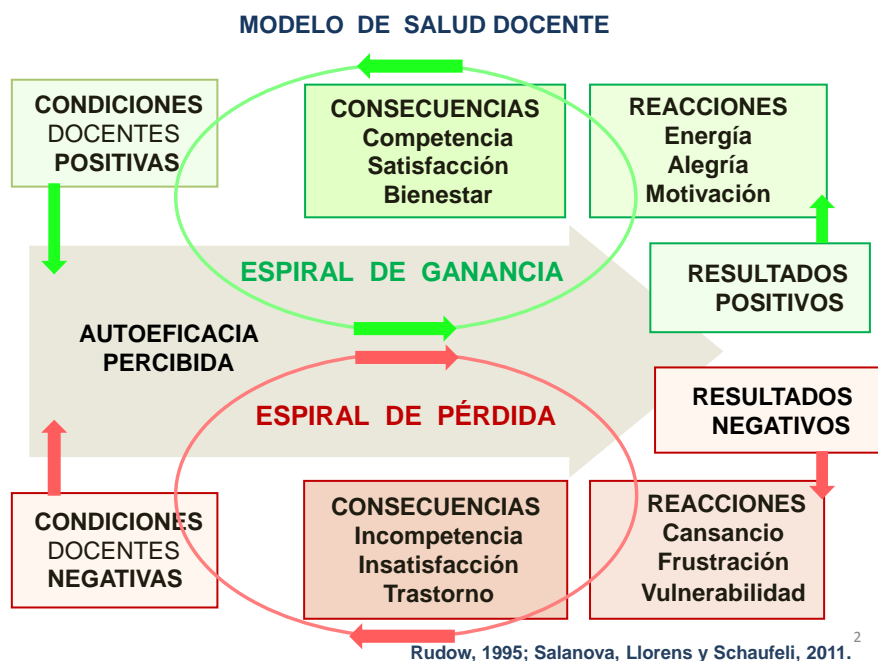
Figura 1. Modelo en espirales positivas y negativas, basados en Rudow (1995) y Salanova y col. (2011).

Por ello, en la evaluación de la salud se entiende que un trabajador está sano no sólo cuando no está enfermo, sino cuando además presenta un estado de funcionamiento óptimo, está motivado por su trabajo, satisfecho, comprometido con la organización y adaptado a su entorno laboral (Salanova et al. , 2011). Por ello, la evaluación de la salud debe incluir aspectos relacionados con el bienestar profesional como son autoeficacia, implicación, vinculación positiva al trabajo y optimismo, entre otros (Schaufeli, 2005).