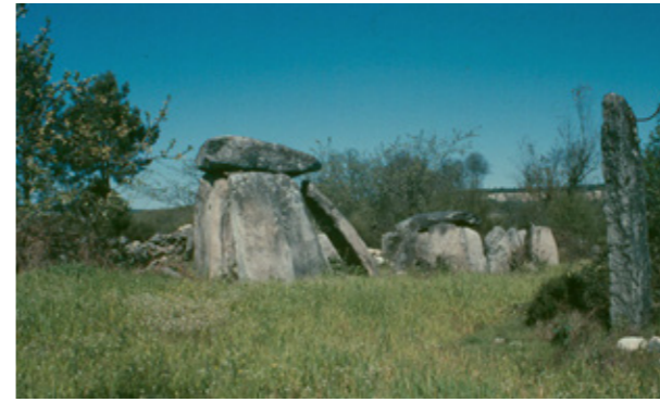
Fig. 1 – Casa da Orca da Cunha Baixa (July 1985). Fig. 2 – Casa da Orca da Cunha Baixa (drawn by Francisco de Almeida Moreira – cf. Vasconcelos, 1897a: Fig.60).