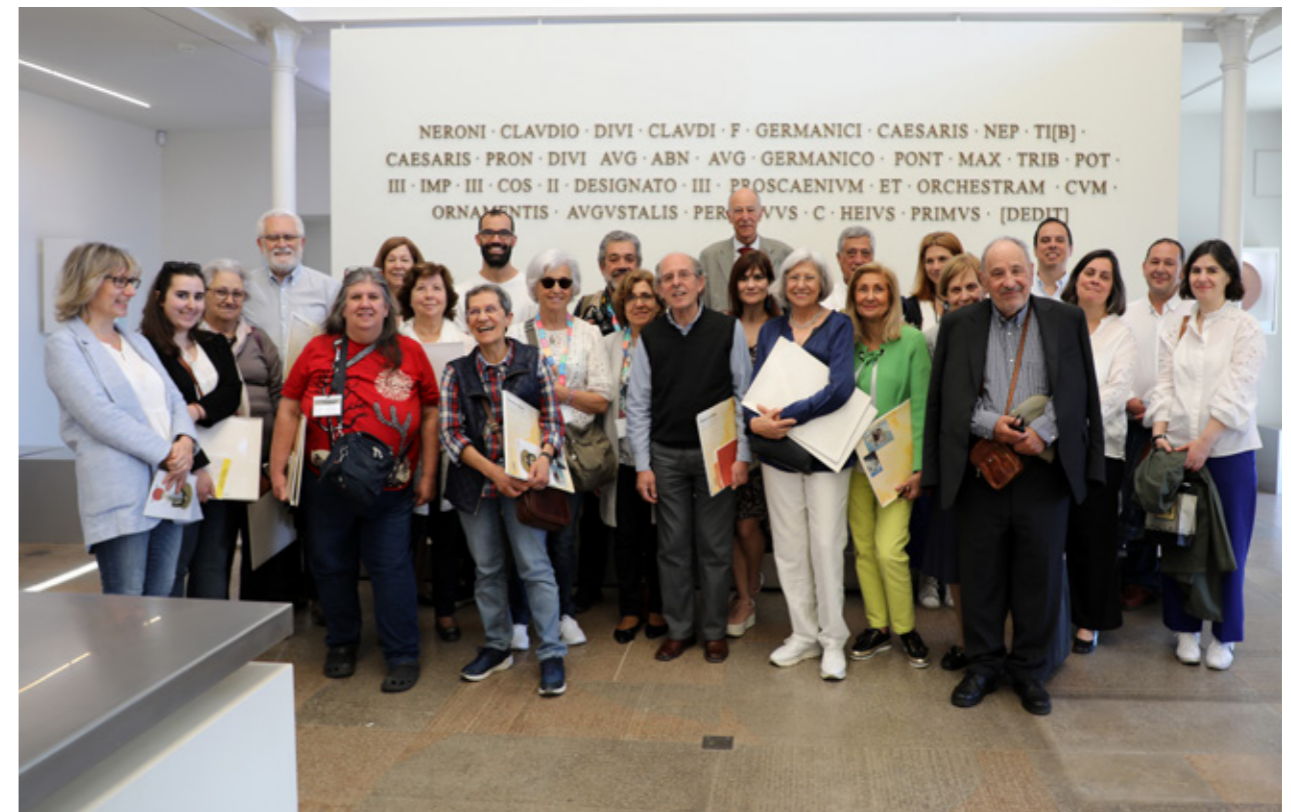
Visita ao Museu de Lisboa - Teatro Romano e apresentação do "Roteiro As Lisboas de Irisalva"