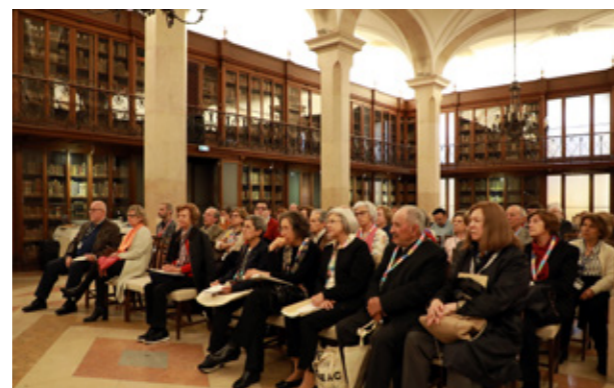
Aspetos dos trabalhos no dia 9 de maio na Sala do Arquivo dos Paços do Concelho