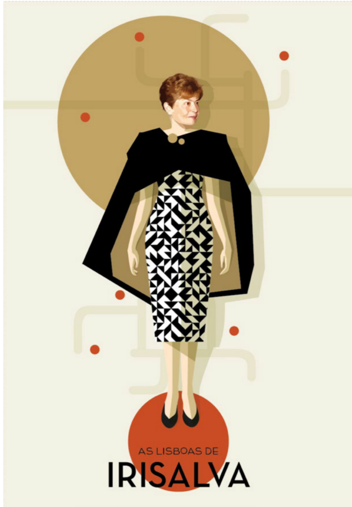
Capa do roteiro.