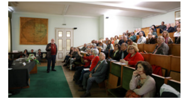
Aspeto dos trabalhos no dia 10 de maio no Auditório Adriano Moreira na Sociedade de Geografia de Lisboa.