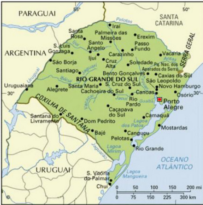
Mapa 1. Santana do Livramento y Uruguaiana 8

Publicado en Pelotas (véase arriba, mapa 1), el Vocabulario Sul Rio-Grandense (página siguiente, Imagen 1) de José Romaguera Correa es igualmente una manifestación de la conciencia que, a finales del siglo XIX, ya se tenía de la singularidad léxica del portugués hablado en Rio Grande do Sul, en particular en zonas fronterizas con los territorios del Río de la Plata.