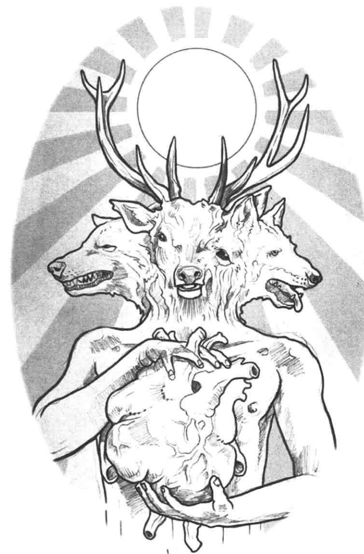
Desenho André Santos