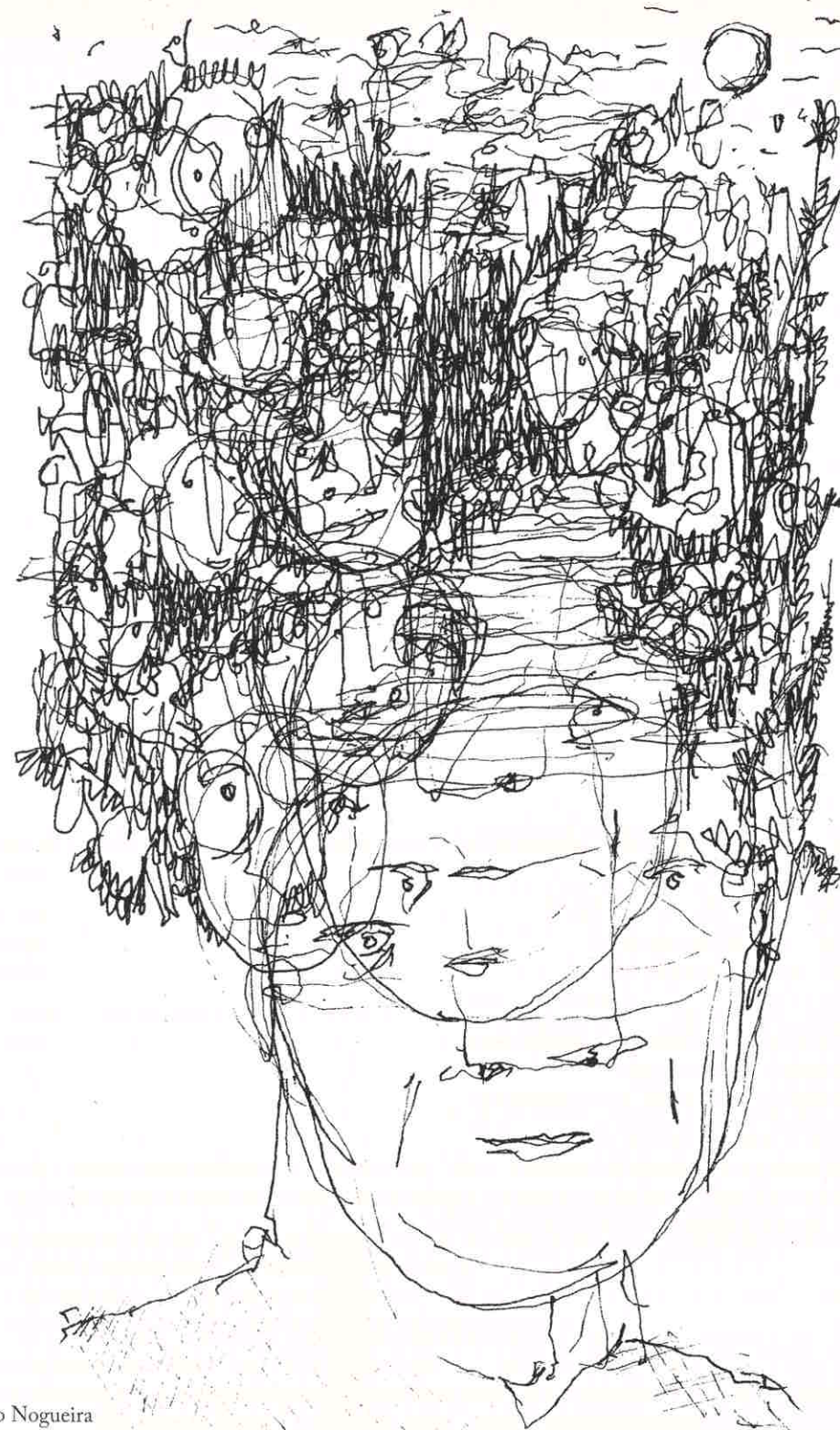
Desenho de Álvaro Nogueira