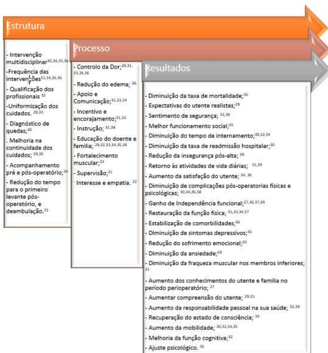
Quadro n.º 2- Indicadores de estrutura, processo e resultados

Começou-se por apresentar os indicadores no quadro n.º 2, segundo as três dimensões da tríade proposta no modelo de Donabedian (estrutura, processos e resultados), um dos principais estudiosos da temática da qualidade na área da saúde. 19