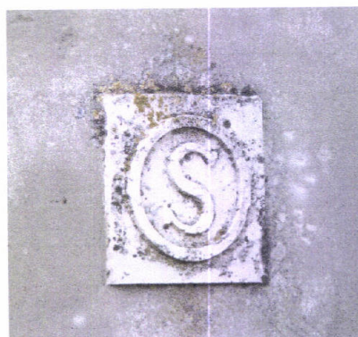
Monograma do Hospital Real de Todos os Santos Sactorum Orbitum

Com o terramoto de 1755, a freguesia de Unhos sofreu muitas destruições mas a mais significativa e descrita na Memória Paroquial diz respeito à Igreja. O mesmo documento refere ainda que [Não tem esta terra convento algú de freires ou freiras (...) e os que desta freguesia levam os sermões e as esmolos são os arrábidos do Convento da Mialhada junto a Loures]