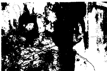
As pedras que se observam nas paredes deste edificio correspondem aos suportes para estender as redes.

Durante o período Moderno, Frielas servia os seus arredores com um porto razoável uma vez que a maior parte da população se dedicava a actividades ligadas ao mar. Unhos particularmente, a par com S. António do Tojal e Frielas, eram locais de