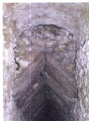
Pormenor do tecto da Galeria Qta. Belo

agoa para doesas e febres malignas (...) o achei entulhado quando tomei posse desta Igreja (...)] (Unhos, 1758). Ao segundo poço, o pároco designa-o de Poço do Concelho [ Tem esta terra hú poço chamado do concelho ao qual se vem buscar agoa de Lisboa e de várias partes para obstruções da dor da pedra (...) ] (Unhos, 1758). Este será o poço designado hoje por “Poço Manuelino”