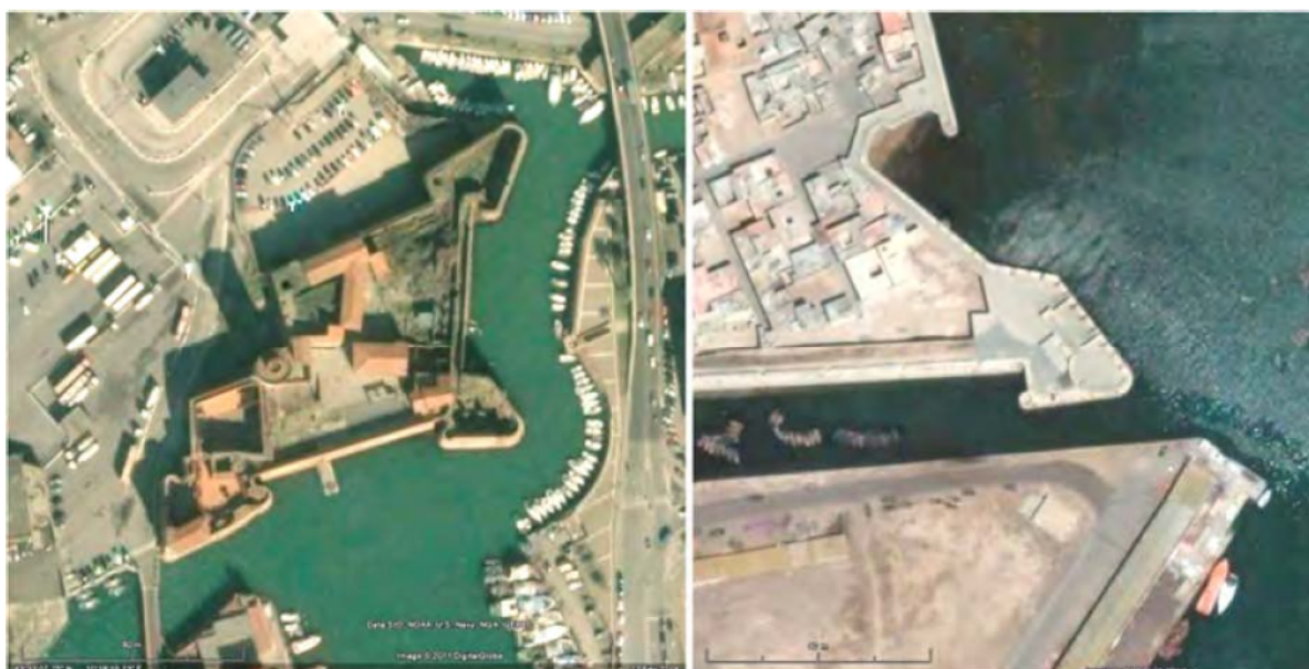
Fig. 5- Fortaleza vieja de Livorno y Fortaleza de Mazagão, baluarte do anjo (fotografías aéreas, 2012) Presentadas en una misma escala.

correspondencia que reconocemos entre la configuración del frente principal de Mazagão y la del frente principal de la fortaleza da Basso, en Florencia - reconocida como el modelo más avanzado de su época - construida por Antonio da Sangallo-el-nuevo entre 1534 y 1537 2 . Con una estructura conceptual semejante, ambos los frentes incluyen un baluarte central servido por puente sobre la cava, a través del cual se hace el acceso al campo exterior, bajo la protección de los baluartes laterales.