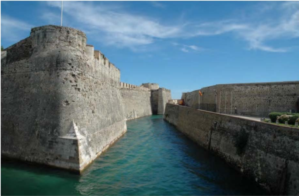
Fig. 3- Baluarte de la bandera, en Ceuta [Matos, 2012, p. 448].

La experiencia adquirida en la construcción de Mazagão ha permitido ensayar y perfeccionar las soluciones que fueron después utilizadas en Ceuta. Benedetto da Ravenna, con su conocimiento sobre fortificación y su experiencia práctica de la guerra, es el responsable por las principales decisiones de proyecto que todavía marcan la estructura y la imagen de la ciudad.