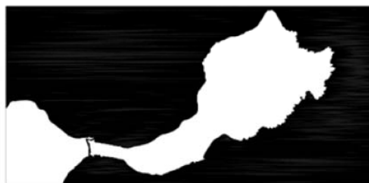
Fig. 1- Del mar contra el continente. Situación geográfica de Mazagão y Ceuta en la década de 1540 [Matos, 2012, p. 461].