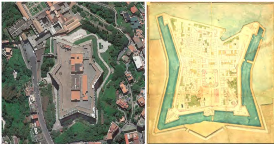
Fig. 7- Fortaleza de San Telmo (fotografía aérea actual) y Fortaleza de Mazagão, plano de 1720 [Matos, 2012, p. 97] presentadas en una misma escala.

lo que nos lleva a establecer la comparación con el castillo de San Telmo en Nápoles, construido por Pedro Luis Escrivá a partir de 1537 y todavía en trabajos a cuando de la construcción de la fortaleza de Mazagão. En ambos los casos, esta característica es dirigida a reforzar la defensa mutua entre cortinas adyacentes. En Mazagão permite además mejorar la defensa de los baluartes desde las cortinas opuestas, lo que