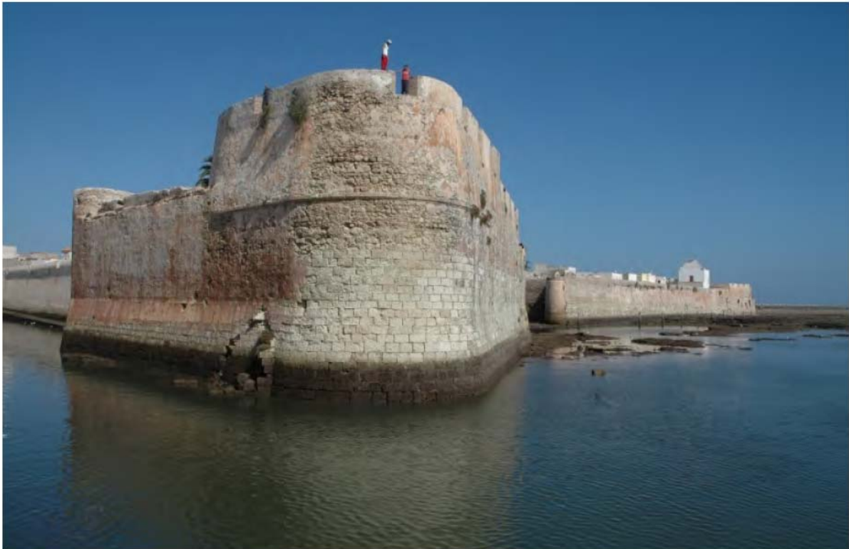
Fig. 2- Baluarte do anjo, en Mazagão [Matos, 2012, p. 201].

la puerta de la ribera. Ninguna de las cañoneras que hoy integran en el frente marítimo existía en el período portugués [Matos, 2012, p. 117]. Una característica específica de la configuración de la fortaleza es la introducción de frentes abaluartados quebrados, con el fin de mejorar las características defensivas del conjunto, al compensar la distancia excesiva que existe entre baluartes.