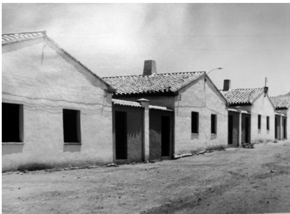
Viviendas del Patronato Nuestra Señora de la Asunción. Instituto de Estudios Giennenses, exp. A-212-5

patio. En la planta alta habría otros dos dormitorios y una cocina común. Cada familia solía tener una parte de las cuadras, y quería destacar la relación entre los animales y la casa. Se ha de remarcar que el acceso a la vivienda era tanto para unos como para otros. Fuentes vivas cuentan que incluso en estas viviendas, en el portal, se trataba con suelo diferente un pasillo ficticio por donde caminaban los animales y que se pavimentaba de manera especial para que estos no resbalaran.