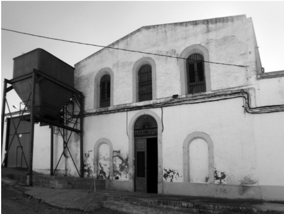
Almazara de Garcéz. Bodega. Portada principal.

tiene lugar a finales del s. XIX como consecuencia de la crisis de la agricultura y de la filoxera. 14 Como muestra de este aumento de producción, el molino de aceite en 1753 tenía dos piedras y dos vigas, y en 1847 pasa a tener ocho vigas.