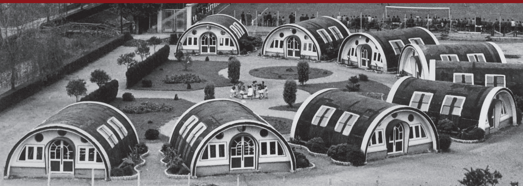
Escuelas "Tubo". Poblado de Llaranes (Avilés)