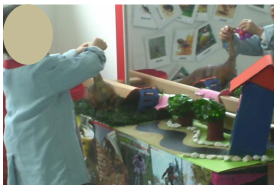
Figura 2: A criança utiliza uma peça de jogo para dar de comer ao dinossauro.

O fantocheiro sensorial, contém uma casa, um parque infantil, uma estrada, árvores, areia, pedras. Todos estes elementos permitem às crianças experimentar diferentes texturas e recriar situações de jogo simbólico, tal como na figura 2, em que R. (2:11) utiliza uma peça de jogo para dar de comer ao dinossauro.