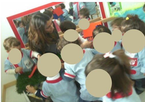
Figura 3: Exploração do fantocheiro.