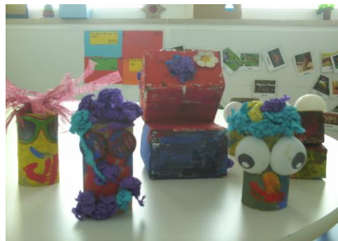
Figura 4: Fantoques.

A satisfação foi tanta que quiseram partilhar o feito com a família e algumas crianças levaram o fantoche para casa, permitindo o envolvimento da família na partilha de momentos significativos para as crianças.