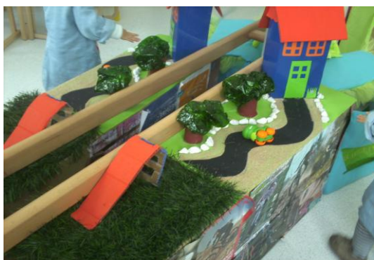
Figura 1: Fantocheiro sensorial

Além de introduzir novos materiais e dar destaque aos que existiam na sala, criei um fantocheiro sensorial. Este fantocheiro continha diversos materiais e espaços que despertavam interesse às crianças, como podemos observar na figura 1.