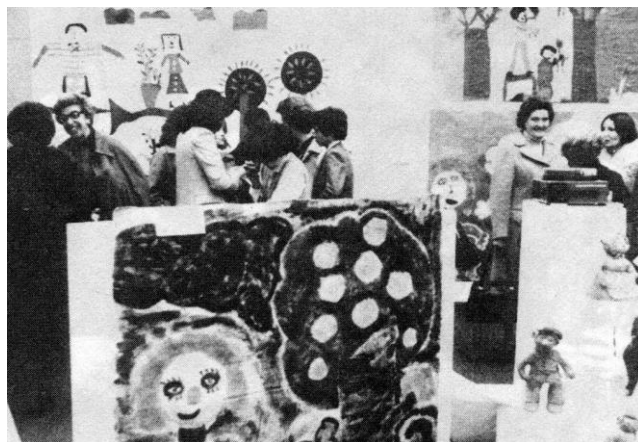
Exposição na SNBA- centros Tutelares de Menores e Junta de Freguesia de S. Mamede