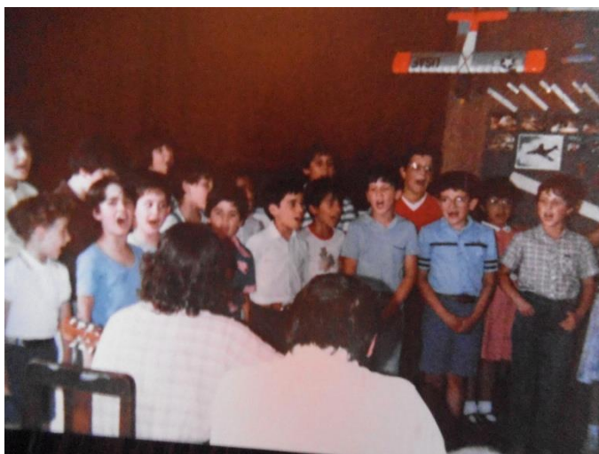
Actividades de Expressão Corporal, Dramática e Musical