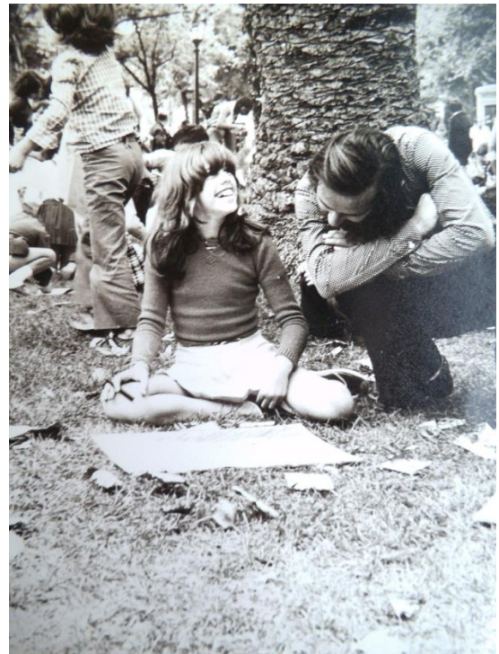
Desenhar ao ar livre- Centros e Escolas de Lisboa