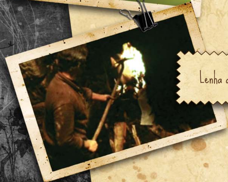
Lenha a arder