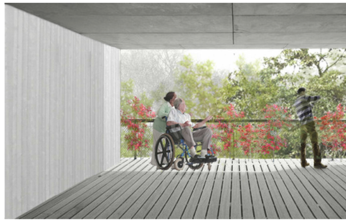
00. Fotomontagem da vista de uma varanda de um módulo habitacional.

parede estrutural do núcleo habitacional em betão armado