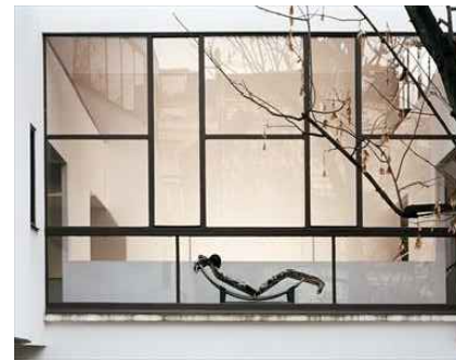
56. Maison la Roche, fachada para o Jardim.