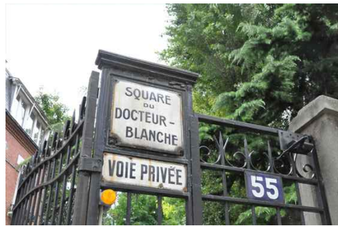
55. Maison La Roche e Janneret, Acesso da rua.