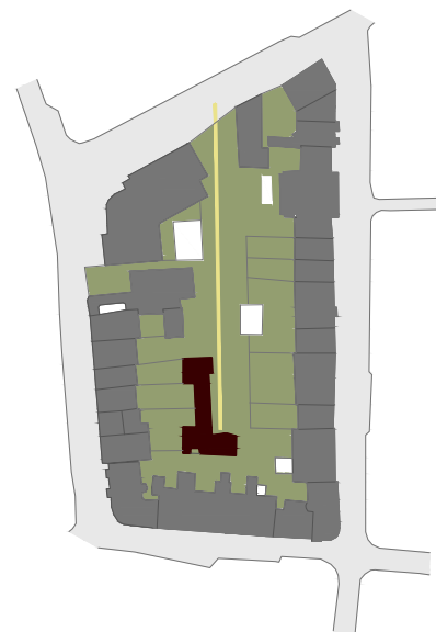
58. Esquema de implantação da Maison la Roche e Janneret de no quarteirão esc. 1/2000 Legenda: ■ Habitações ■ Acesso ■ Espaços verdes

O edifício exprime-se exteriormente como um único, apesar da diferença de pisos, no entanto contempla duas habitações de contextos habitacionais diferentes. É no interior, e através do desenho dos espaços que se distinguem. O edifício relaciona-se sobretudo com a envolvente arbórea, uma vez que se implanta afastado dos edifícios limite do quarteirão e dos seus logradouros. No fundo, assume o miolo de quarteirão como sendo o seu jardim, não só de contemplação, mas de lazer. No entanto o respeito pela cêrcea envolvente é mantido e a elevação do solo da zona da galeria de arte da maison la Roche, permite perceber o cuidado para manter a continuidade visual do percurso após as habitações, sem que estas se imponham e quebrem o contínuo verde existente no miolo de quarteirão.