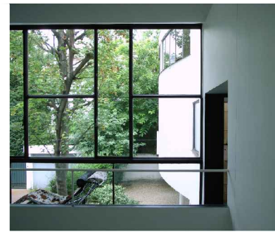
57. Maison la Roche, vista para o jardim de interior de quarteirão.