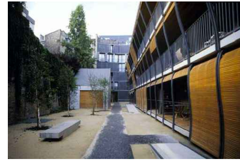
47. Apartamento rue de Suisses, Jardim comum

10. Citação de Herzog & de Meuron em http://www.herzogdeuron.com , acerca do projecto de habitação colectiva para a Rue de Suisses, Paris.