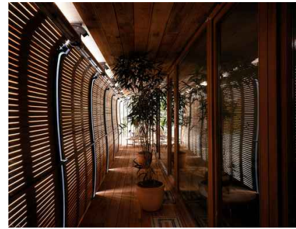
46. Apartamentos interior de quarteirão, varandas piso 0