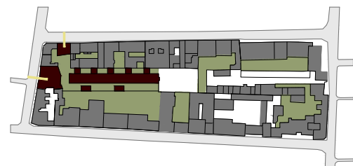
48. Esquema de implantação do complexo habitacional no quarteirão esc. 1/2000

Parte das habitações ao nível do piso térreo, no interior de quarteirão, dispõe de pátios privados, procurando uma relação clara com este interior ajardinado e explorando a ideia de habitação rural no meio urbano.