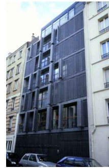
45. Rue de Suisses, Fachada