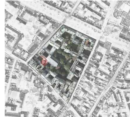
36. Ortofotomapa Maison de Verre.

Este tipo de implantação de emergência, reporta-nos hoje para pedaços de cidade de qualidades únicas. Ao entrar nestes espaços reconhecemos outras qualidades à cidade e reconhecemos estas construções como únicas, talvez reveladoras da envolvente, mas também das necessidades e condicionantes da época.