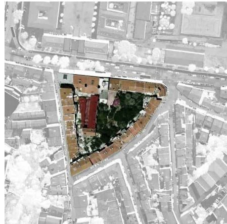
33. Ortofotomapa da Vila operária "Rodrigues".