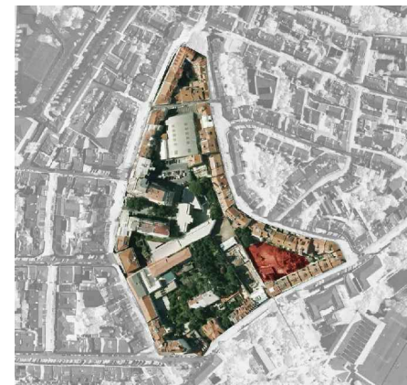
38. Ortofotomapa duas habitações em Santa Isabel.

Os restantes casos de estudo destacam-se pela autenticidade e valor arquitectónico. Reconhecer-lhe-emos características únicas pela integração peculiar, em interior de quarteirão, e pela riqueza formal e espacial que as caracteriza. De autores, tempos, envolvente e abordagens diferentes, estas habitações terão em comum aspectos identificativos de uma intervenção em interior de quarteirão, constituindo uma fonte de inspiração para o desenvolvimento do trabalho final de curso.