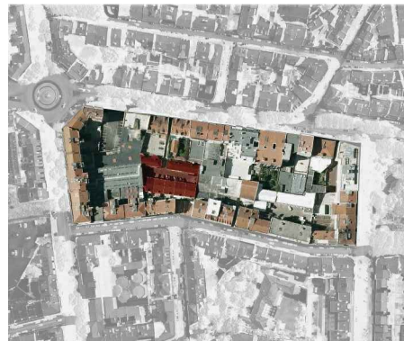
34. Ortofotomapa da Vila operária "Luz".