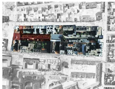
35. Ortofotomapa complexo habitacional rue de Suisses.