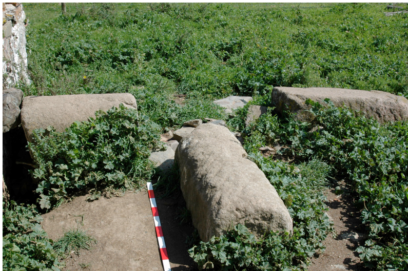
Aldinha (13.50): Materiais de construção depositados no pátio do monte.