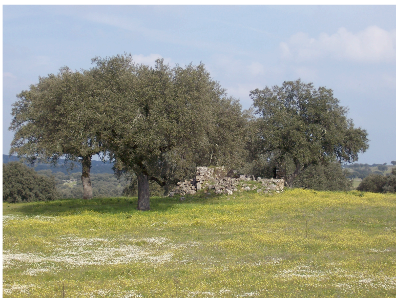
S. Cornélio (13.12): ruínas de alegada antiga ermida. Na envolvente encontra-se a mancha de materiais romanos.