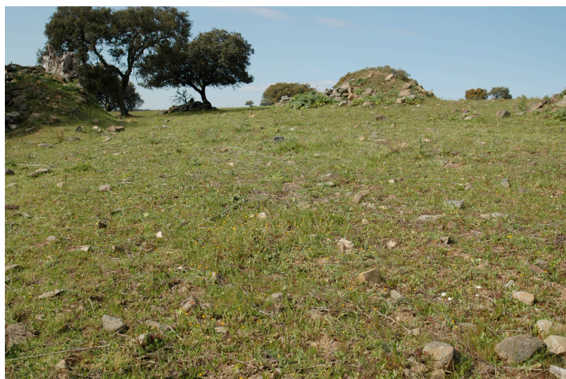
Poço do Mesquita (13.37): mancha de materiais em torno de um moroiço.