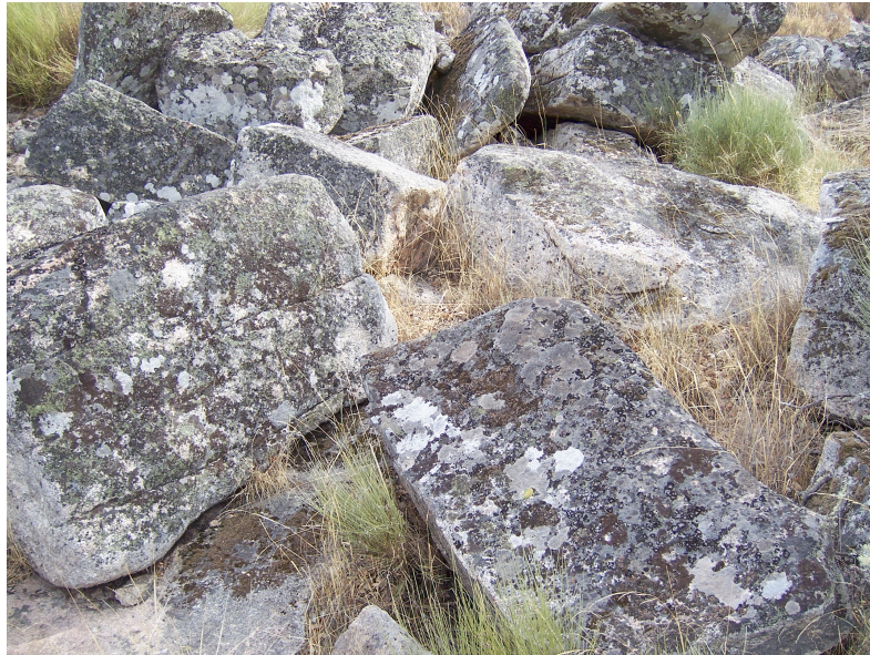
Pitaranha (12.34): blocos deixados por terminar na área da pedreira