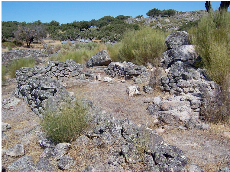
Patinha da Burra (12.18): um dos núcleos de construções mais próximas da linha de água.