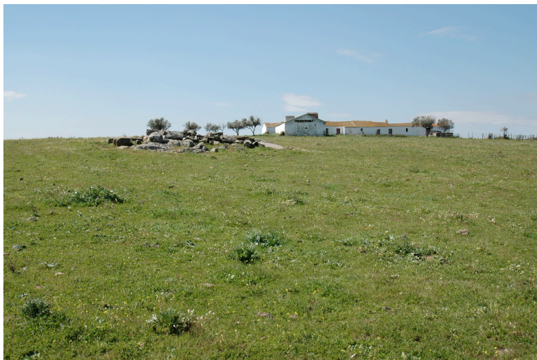
Monte da Aldinha (13.50): vista geral da implantação. Na plataforma junto ao moroiço de pedras encontra-se a maior densidade de vestígios.