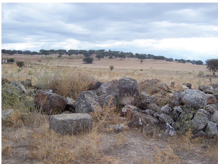
Reguengo 2 (13.15): materiais de construção amontoados em moroiço.