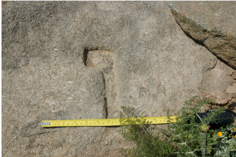
Poço do Mesquita (13.37): silhar de granito gravado que se encontra depositado em moroiço visto na imagem anterior.