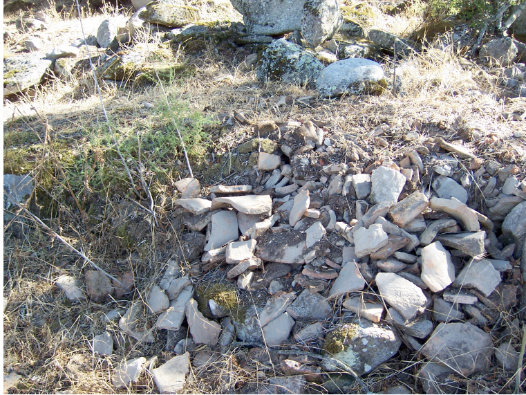
Monte Velho (12.12): Aglomerado de cerâmicas de construção em meio à área intervencionada por Afonso do Paço.