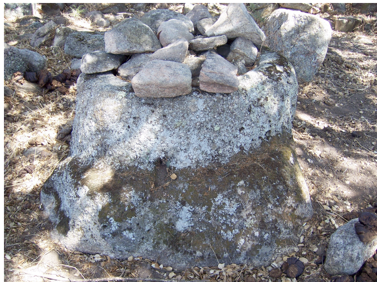
Patinha da Burra (12.18): lagareta rupestre no centro do povoado, com materiais cerâmicos e pétreos depositados no topo.