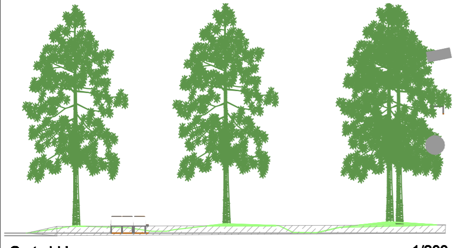
Corte bb' 1/200