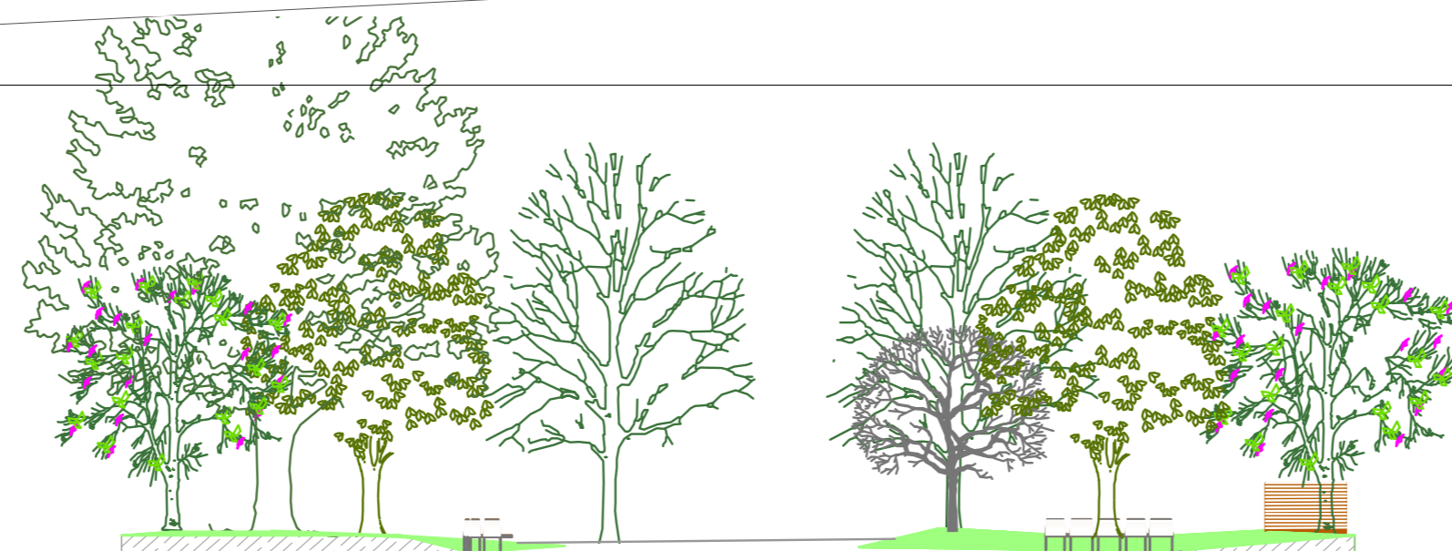
Corte cc' 1/200