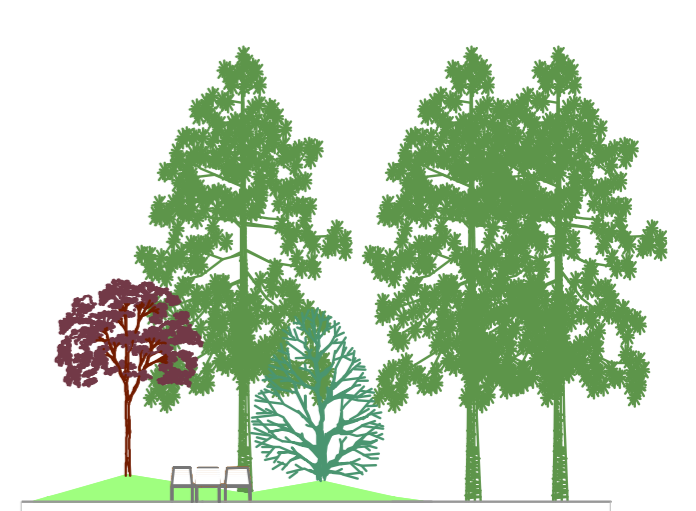
Corte aa' 1/200