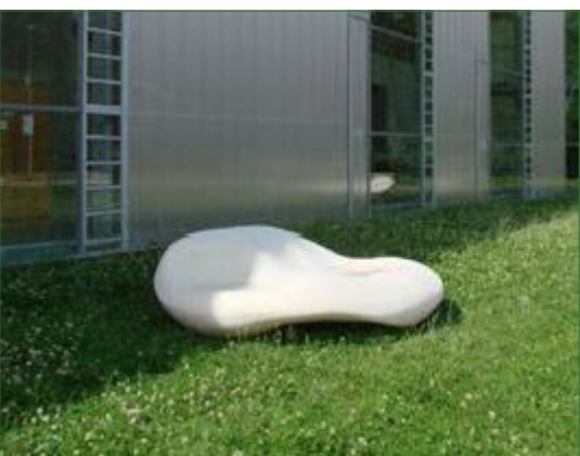
d- Banco plástico tipo IP6 Larus, cor branca/cinza Dimensões: 2.6x2x0.72m Quantidade: 2