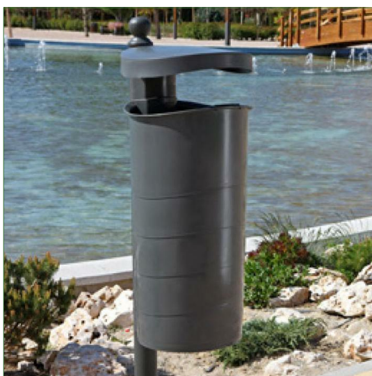
b- Papeleira tipo Contener Millenium 50. Dimensões: 85x36.5cm Quantidade: 3