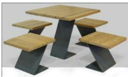
a- Mesa com quatro bancos tipo "zig mini" tetadesign ou equivalente. Dimensões: 1.72x0.75x1.72m Quantidade: 4