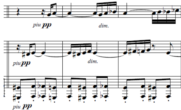
Figura 6 - Canon a la sexta menor.

La Transición comienza en el compás 43 y está compuesta a partir de elementos del tema b . Observamos una zona de imitaciones de motivos entre tuba y piano con un ostinato en la mano izquierda del piano tomada de la sección A . En el compás 55 volvemos a encontrar un canon entre tuba y piano a la 6ª menor formada por motivos de la sección A .