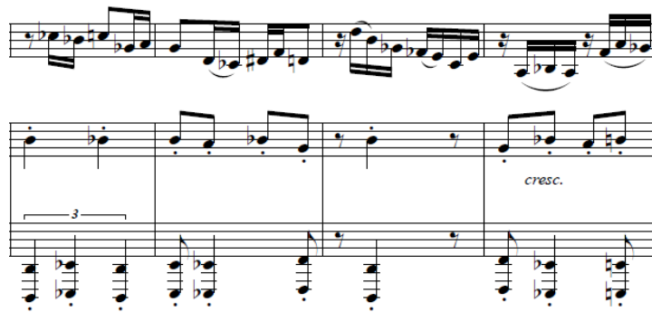
Figura 19 - Acompañamiento en espejo compás 270.

La parte B (277-290) comienza con el mismo acompañamiento que a'' y un canon que comienza en la tuba en el compás 278 y continúa el piano al 281. Las corcheas de la tuba en el compás 282 coinciden con la cabeza del tema del 278.