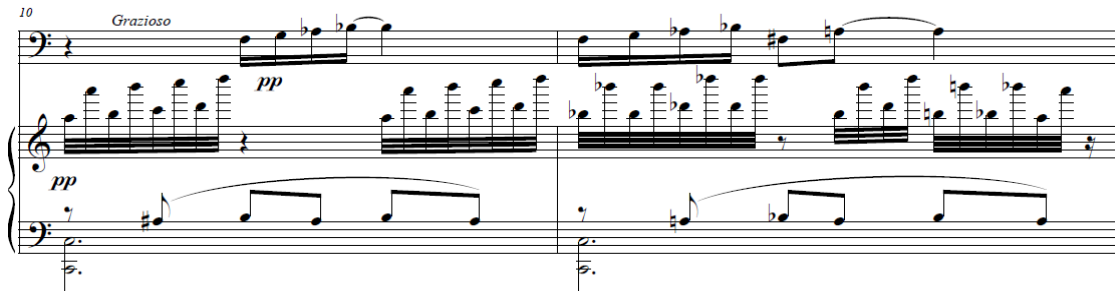
Figura 2 - Canon a la tercera mayor.

un nuevo canon esta vez a la 3ª Mayor incompleto proporcionando mediante este doble canon un carácter de tensión inconcluyente.