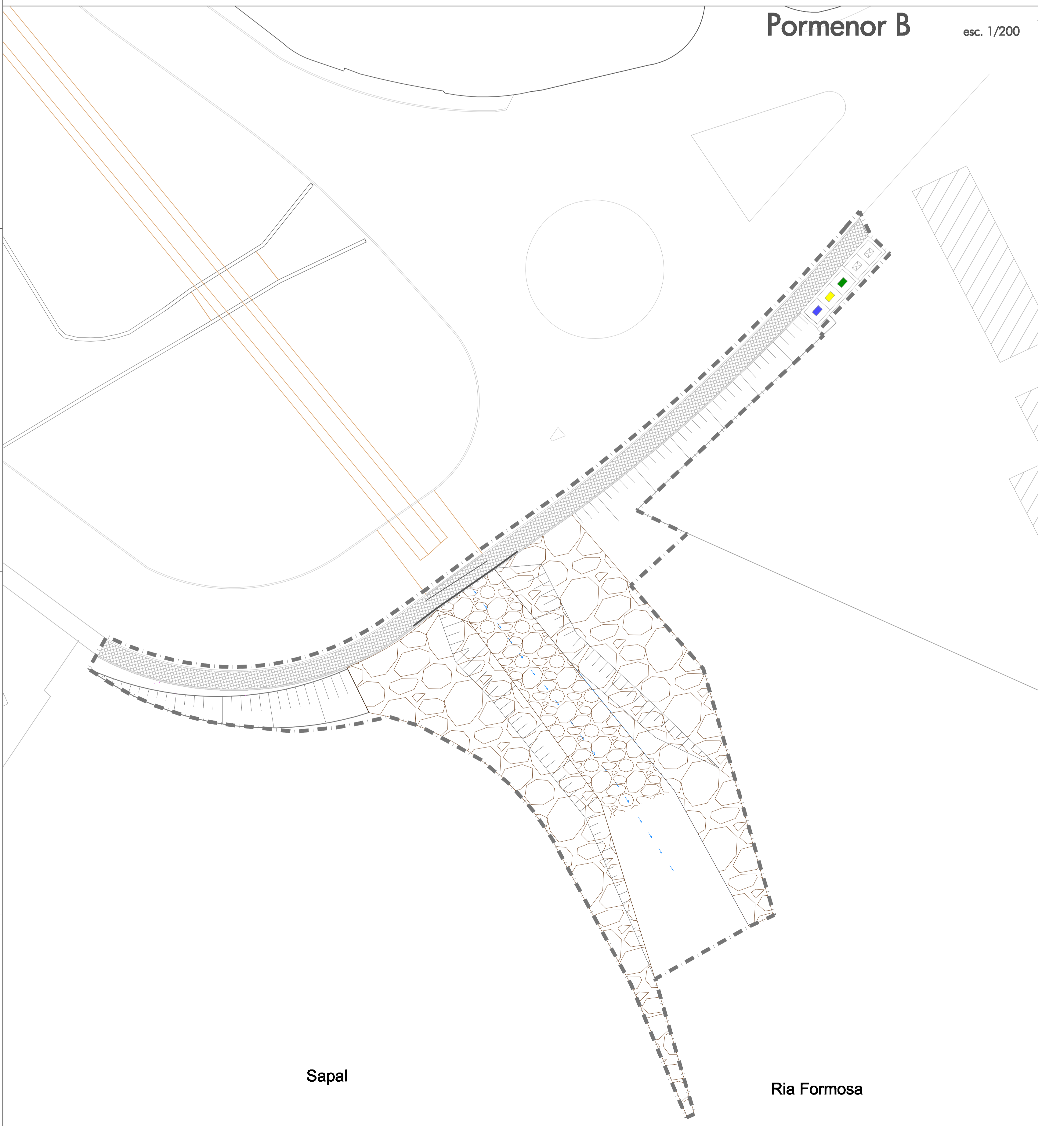
Pormenor B esc. 1/200